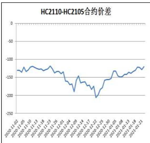
图6：热卷与螺纹跨品种套利

本周，HC2110合约走势强于HC2105合约，22日价差为-121元/吨，较上周五+13元/吨。