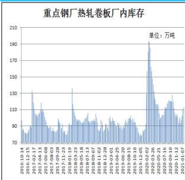
图9：样本钢厂热卷厂内库存

1月21日，据Mysteel监测的全国37家热轧板卷生产企业中热卷厂内库存量为112.74万吨，较上周增加2.85万吨，较去年同期增加20.62万吨。