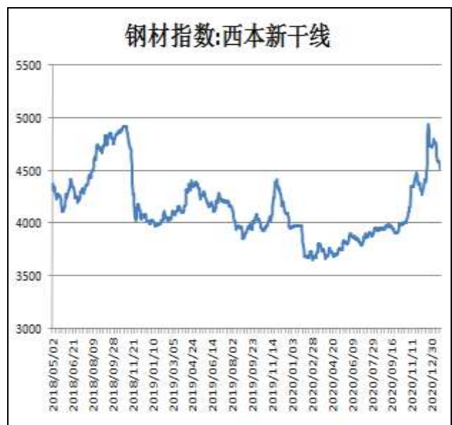
图2：西本新干线钢材价格指数

1月22日，上海热轧卷板5.75mm Q235现货报价为4470元/吨，周环比-80元/吨；全国均价为4505元/吨，周环比-37元/吨。