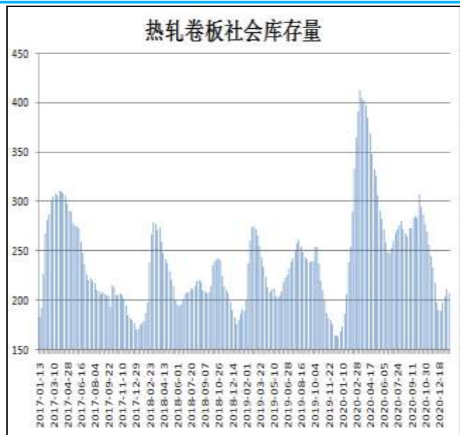
图10：全国33城热卷社会库存

1月21日，据Mysteel监测的全国33个主要城市社会库存为206.66万吨，较上周减少4.45万吨，较去年同期增加0.23万吨。