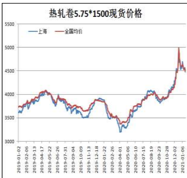
图1：热轧卷板现货价

1月22日，上海热轧卷板5.75mm Q235现货报价为4470元/吨，周环比-80元/吨；全国均价为4505元/吨，周环比-37元/吨。