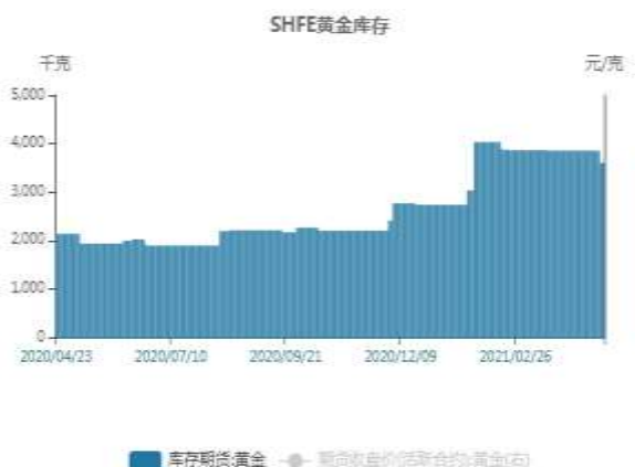
图15：SHFE黄金库存走势图