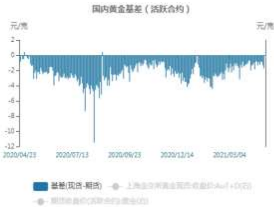
图7：国内黄金基差贴水走势图