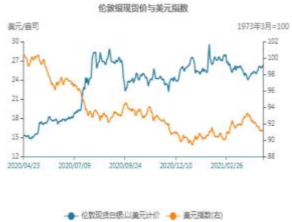
图14：白银与美元指数相关性走势图