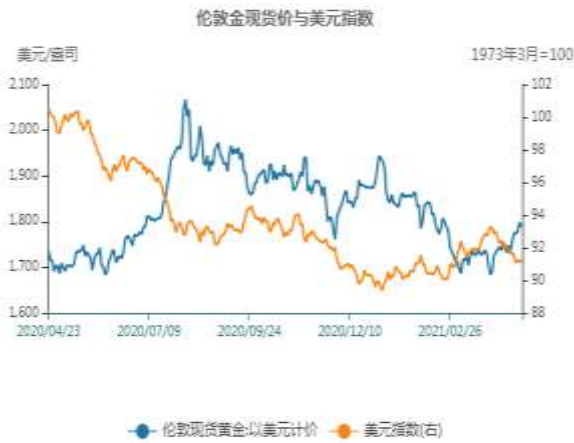
图13：黄金与美元指数相关性走势图