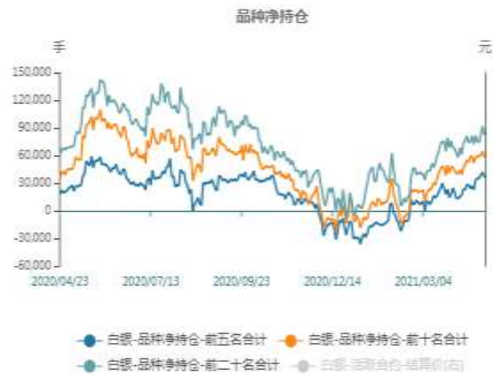
图2：沪银期货净持仓走势图