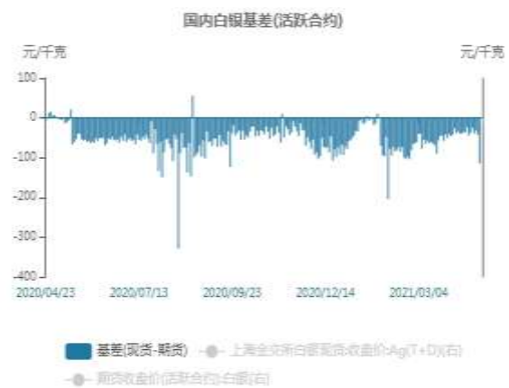
图10：国内白银跨期价差走势图