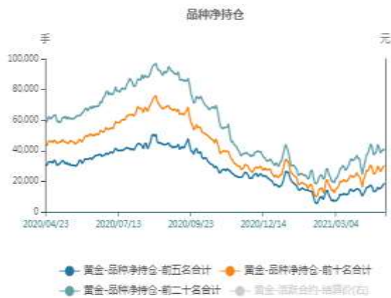
图1：沪金期货净持仓走势图