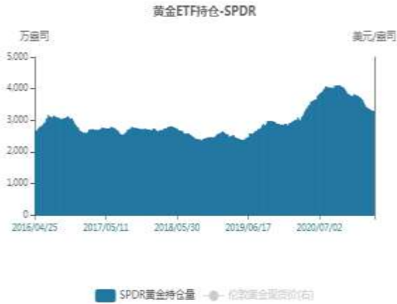
图5：黄金ETF持仓走势图