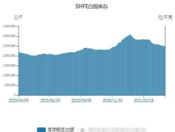
图16：SHFE白银库存走势图