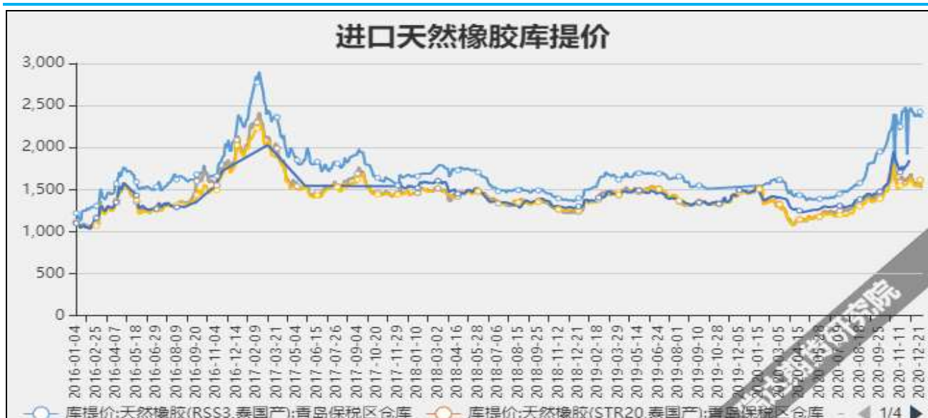
图3 进口天然橡胶库提价

截至1月22日, 上海市场19年国营全乳胶报13875元/吨, 较上周-100元/吨。