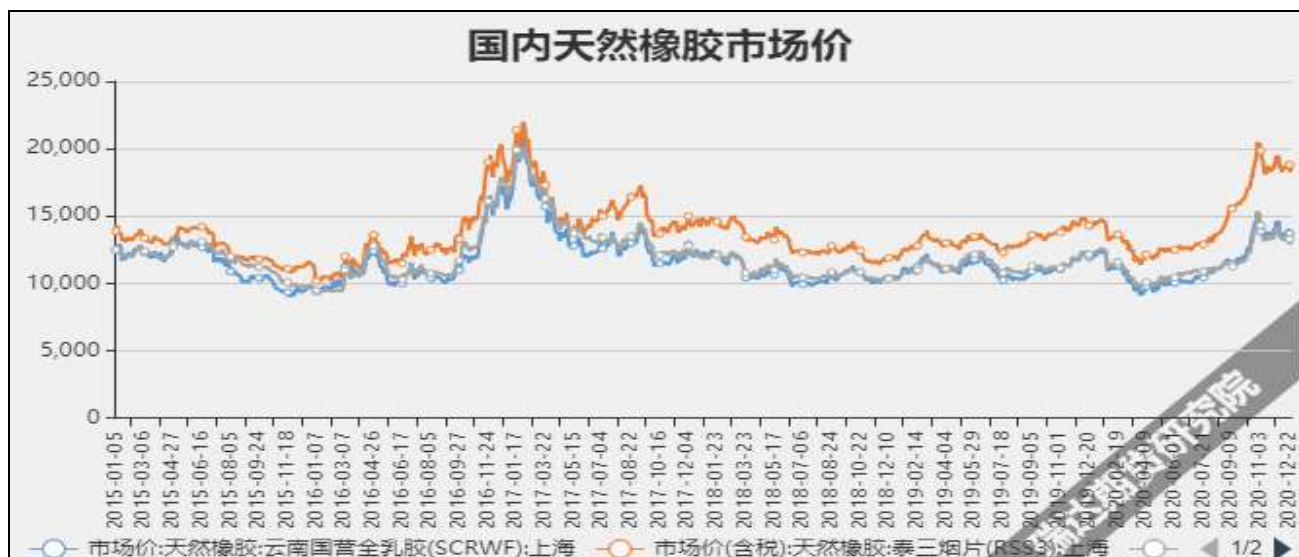
图2 国内天然橡胶市场价