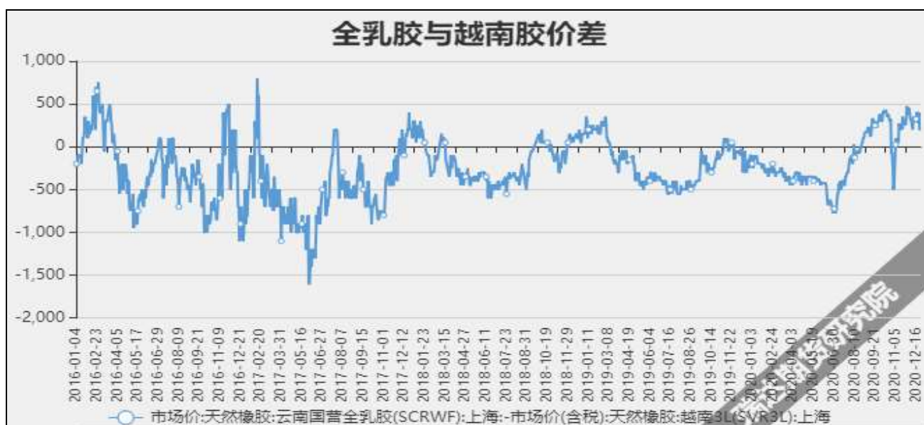
图7 全乳胶与越南3L价差