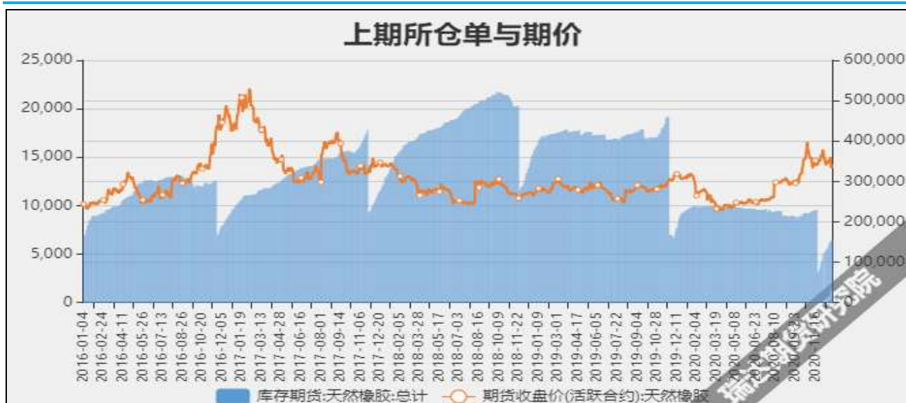
图11 沪胶期价与仓单走势对比