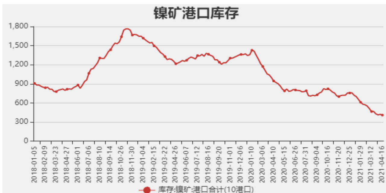
图3：国内镍矿港口库存