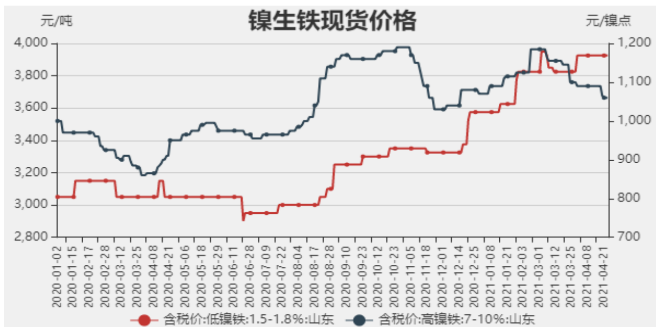
图1：镍生铁现货价格

截止至2021年4月23日，以山东地区为例，低镍铁（FeNi1.5-1.8）价格为3925元/吨，较上周持平，高镍生铁（FeNi7-10）价格为1060元/镍点，较上周下跌30元/镍点。