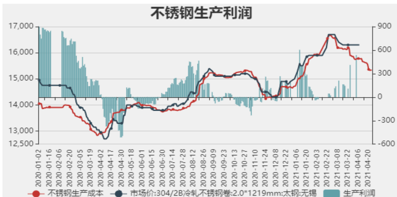
图9：不锈钢生产利润