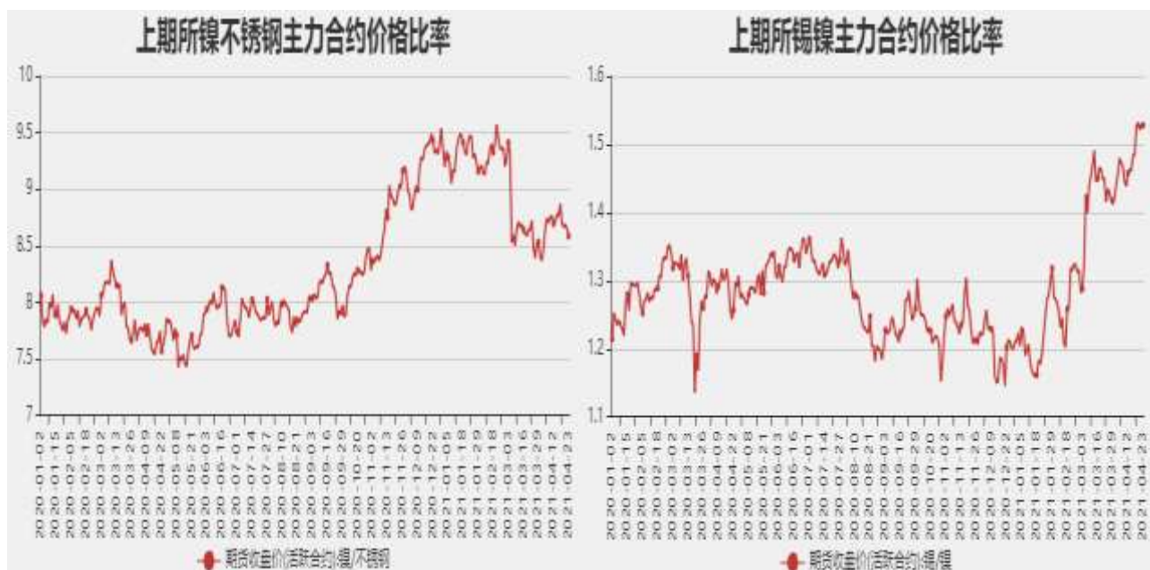
图11：沪锡和沪镍主力合约价格比率

截止至4月23日，镍不锈钢以收盘价计算当前比价为8.5855，锡镍以收盘价计算当前比价为1.5280。