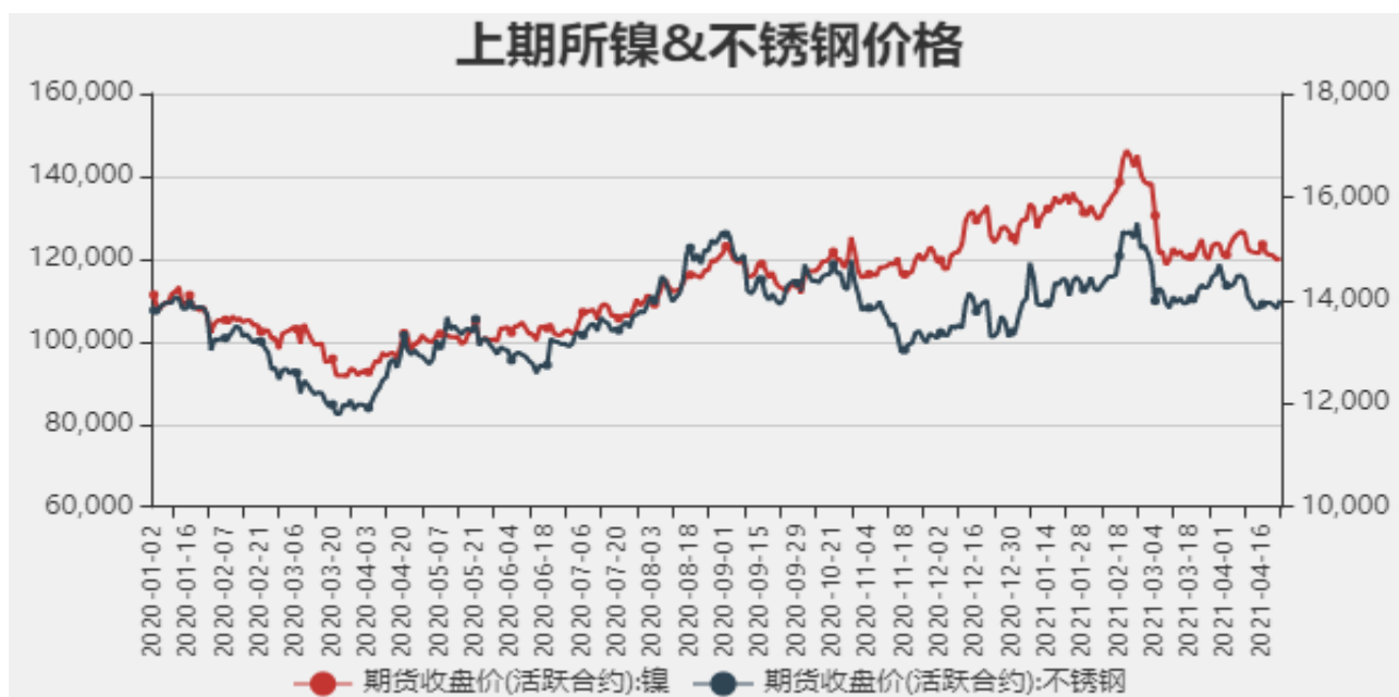
图2：国内镍现货价格

截止至2021年4月23日，沪镍期货价格为120240元/吨，不锈钢期货价格为14005元/吨。