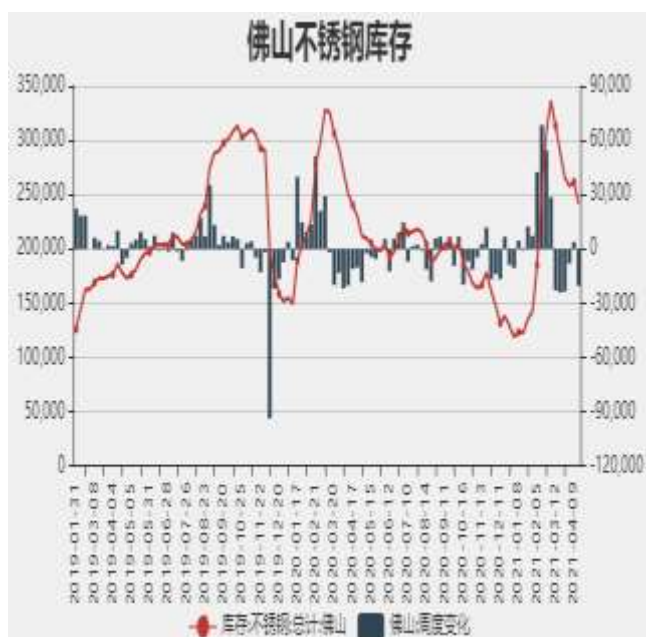
图5：佛山不锈钢月度库存