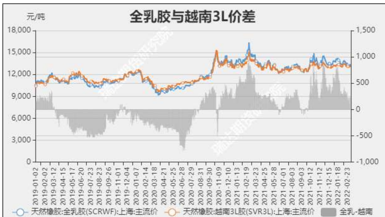
图6 全乳胶与越南3L价差