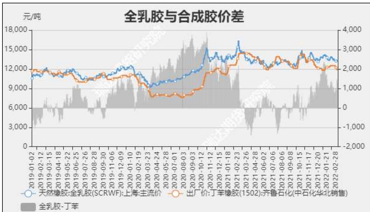
图9 全乳胶与合成胶价差

截至3月11日，华北市场丁苯橡胶12800元/吨，较上周+900元/吨；华北市场顺丁橡胶报13600元/吨，较上周+800元/吨。