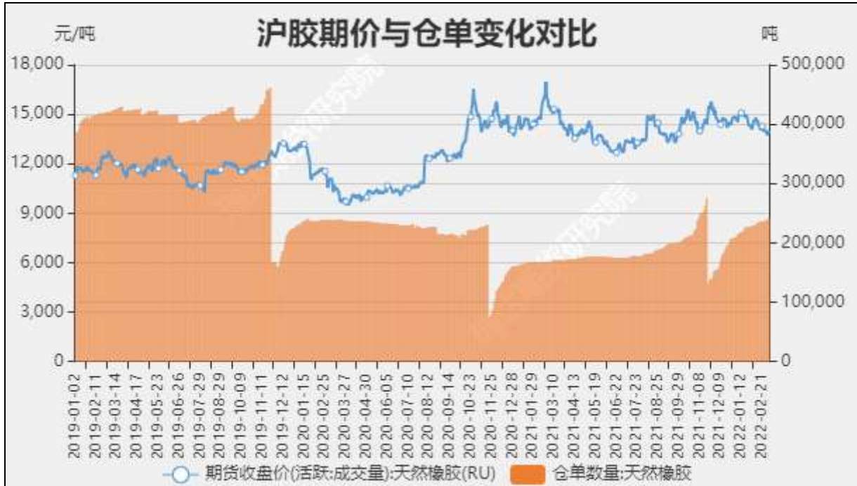
图10 沪胶期价与仓单走势对比