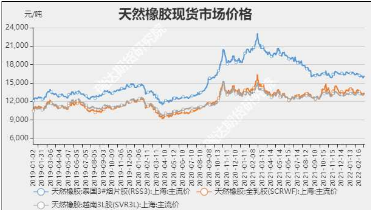
图2 国内天然橡胶市场价

截至3月11日当周，泰国合艾原料市场田间胶水68（-2.5）泰铢/公斤；杯胶50.55（-0.45）泰铢/公斤。