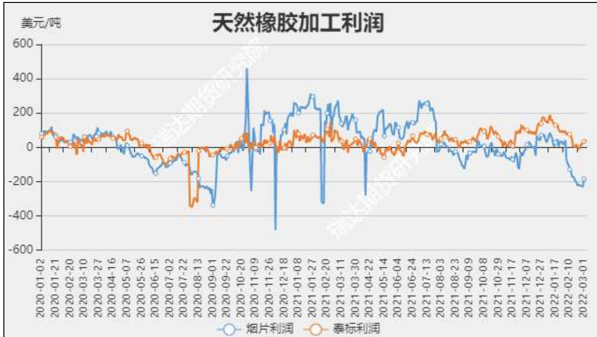
图12 标胶和烟片加工利润

截至3月11日，全钢胎厂家开工率61.94%，环比+1.46%；国内半钢胎厂家开工率为72%，环比+4.61%。