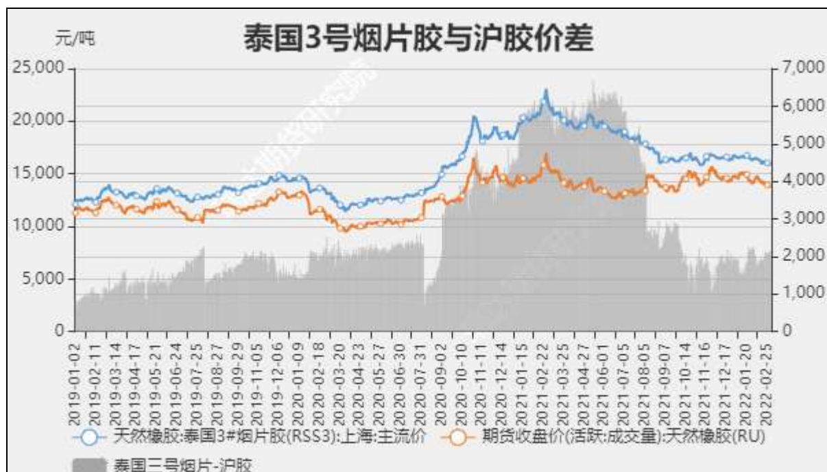
图7 泰国3号烟片与沪胶价差