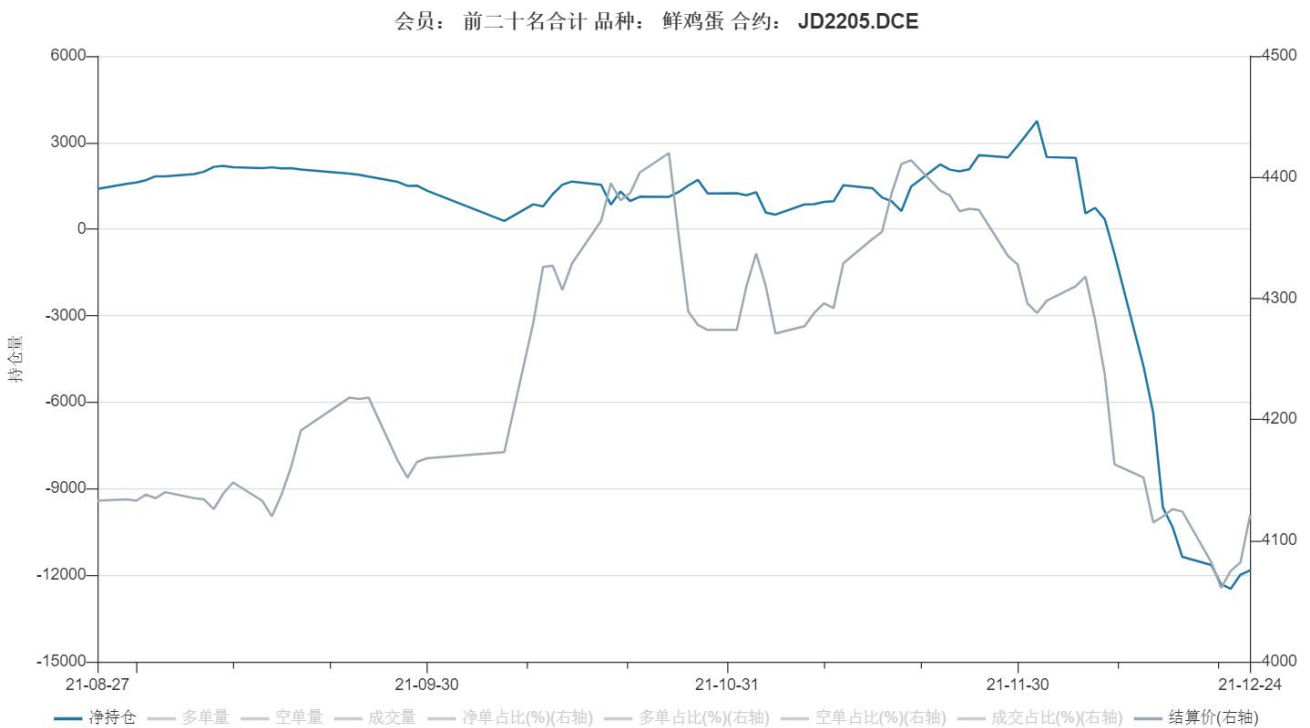
图6：鸡蛋 2205合约前二十名主力资金净持仓情况

6、本周期价探底回升，2205合约净持仓-11831，净空持仓变化不大，市场指引有限。