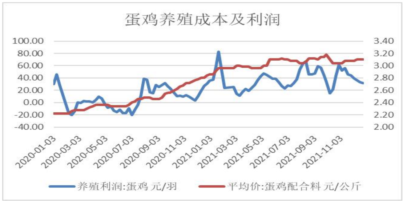
图3：蛋鸡养殖利润变化图

3、截止12月24日，蛋鸡养殖利润报+31.54元/羽，较上周-1.53元/羽；蛋鸡配合料价格报3.10元/公斤。