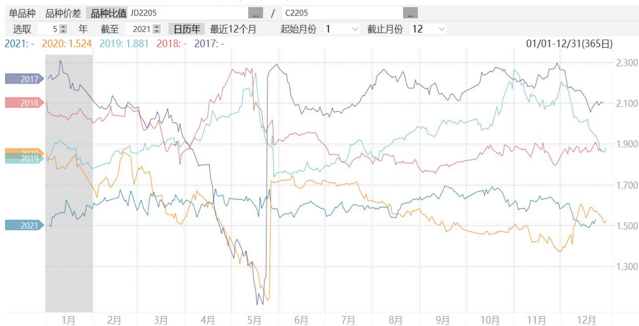
图9：鸡蛋2205合约与玉米2205合约期价比值走势图

9、截至周五，鸡蛋2205合约与玉米2205合约期价比值为2.101,处于同期较高水平。