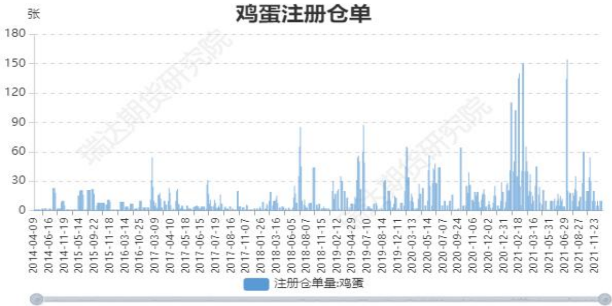
图5：大商所鸡蛋期货注册仓单量