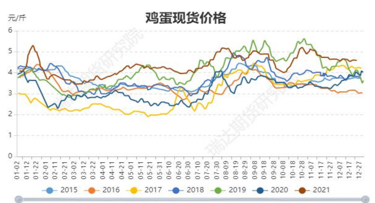
图4：全国鸡蛋现货均价季节性走势图