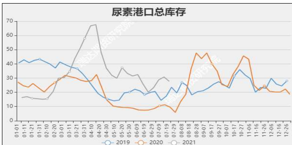
图9 国内尿素港口库存