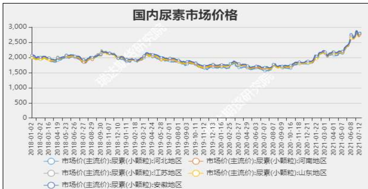
图3 国内尿素市场主流价

截至7月22日，NYMEX天然气收盘价4美元/百万英热单位，较上周+0.38美元/百万英热单位。