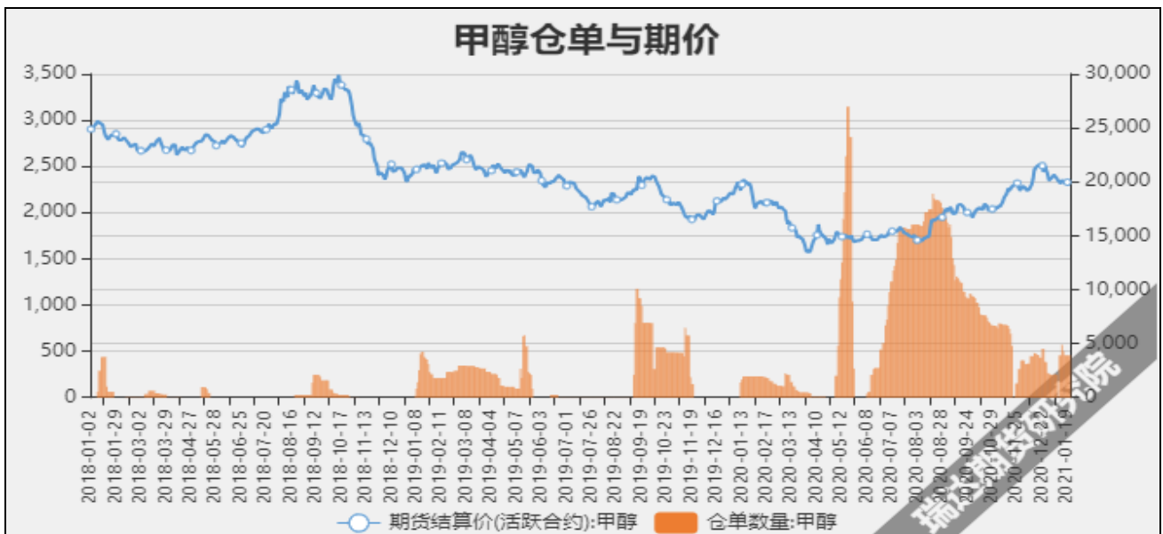
图7 甲醇期价与仓单数量