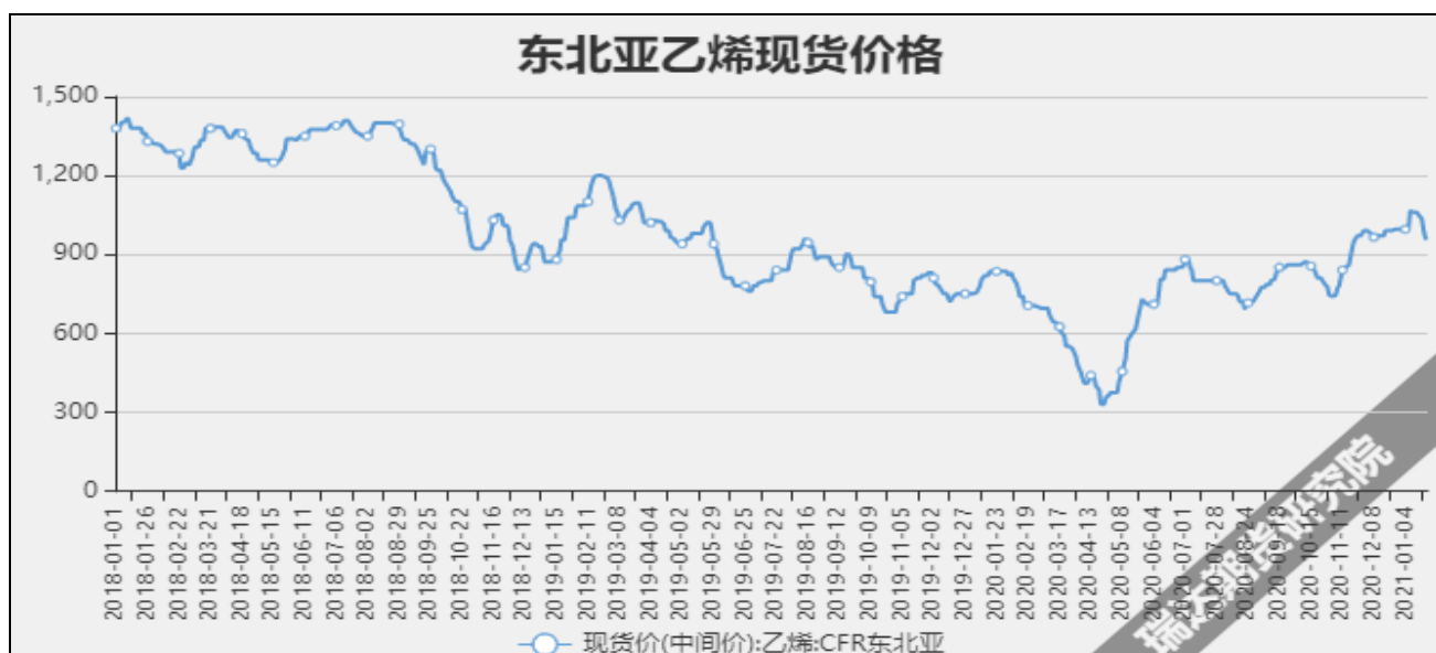
图13 东北亚乙烯现货价

截至1月27日当周，内陆地区部分甲醇代表性企业库存量31.67万吨，较上周-2.45万吨。