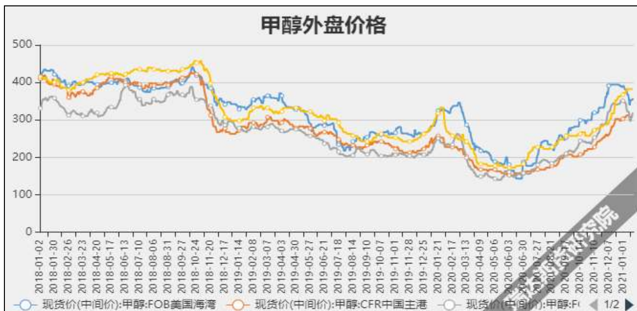
图5 外盘甲醇现货价格