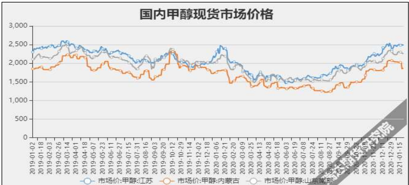
图3 甲醇现货市场主流价

截至1月28日，NYMEX天然气收盘价2.68美元/百万英热单位，较上周+0.19美元/百万英热单位。