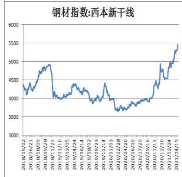
图2：西本新干线钢材价格指数

4月30日，上海热轧卷板5.75mm Q235现货报价为5770元/吨，周环比+160元/吨；全国均价为5748元/吨，周环比+127元/吨。