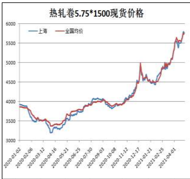
图1：热轧卷板现货价

4月30日，上海热轧卷板5.75mm Q235现货报价为5770元/吨，周环比+160元/吨；全国均价为5748元/吨，周环比+127元/吨。