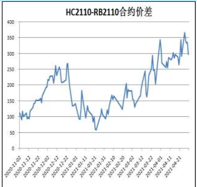
图6：热卷与螺纹跨品种套利

本周，HC2110合约走势强于RB2110合约，30日价差为297元/吨，周环比+6元/吨。