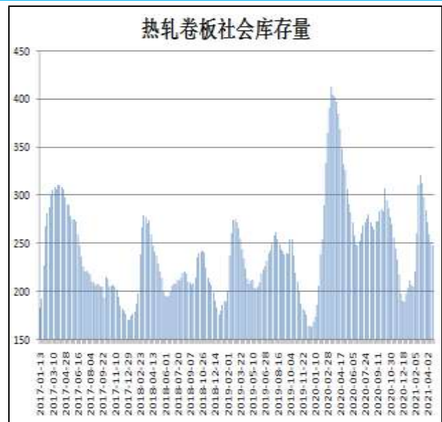
图10：全国33城热卷社会库存

4月29日，据Mysteel监测的全国33个主要城市社会库存为244.83万吨，较上周减少3.5万吨，较去年同期减少87.89万吨。