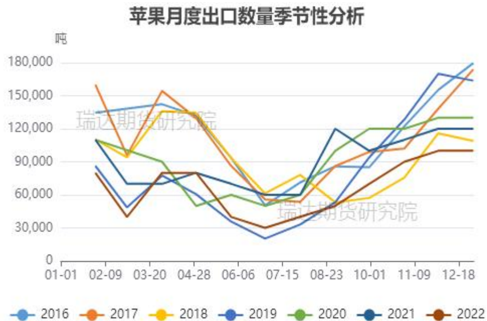
图、苹果出口量季节性情况