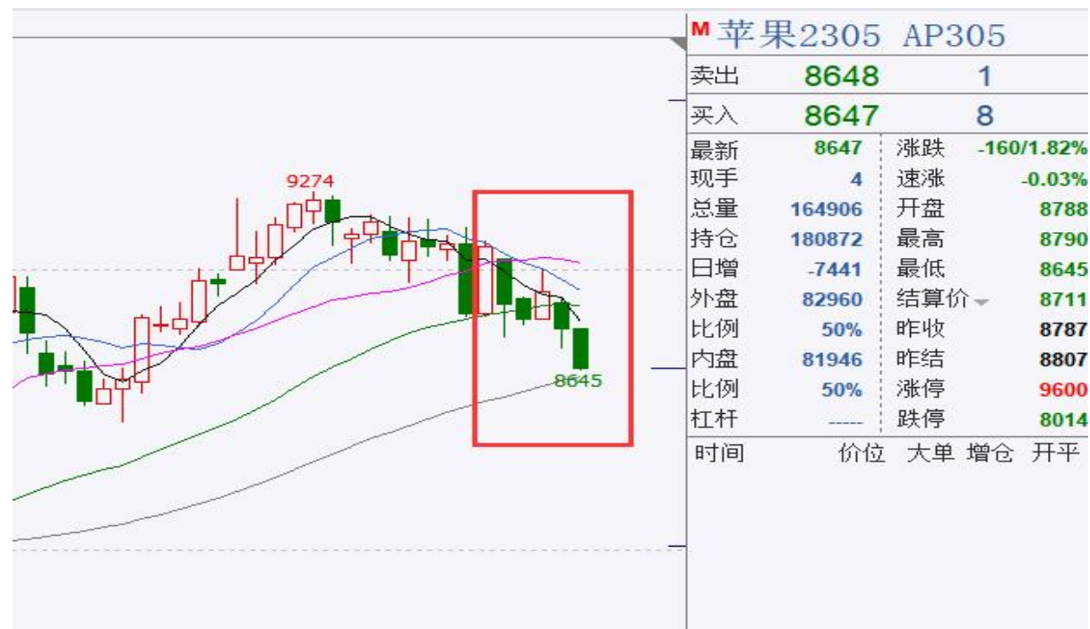
图、苹果主力合约价格走势