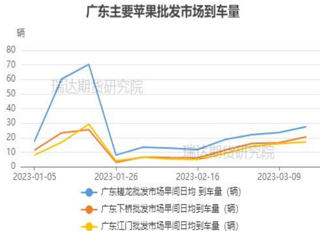
图、苹果批发市场-广东主要批发市场到车量