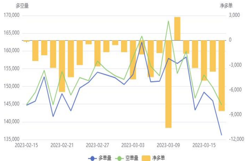
苹果(AP)前20持仓量变化