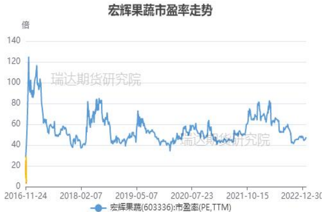
图、宏辉果蔬市盈率