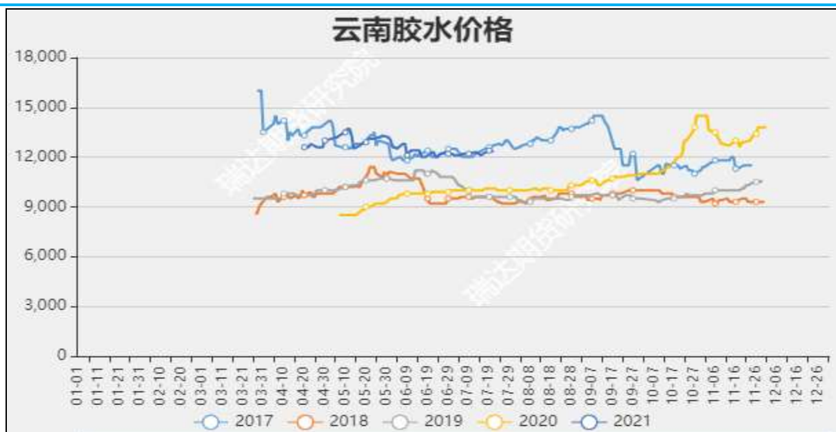
图2 云南胶水收购价

截至7月30日当周，泰国合艾原料市场田间胶水45.5 (+4) 泰铢/公斤；杯胶45.7(+2.23) 泰铢/公斤。