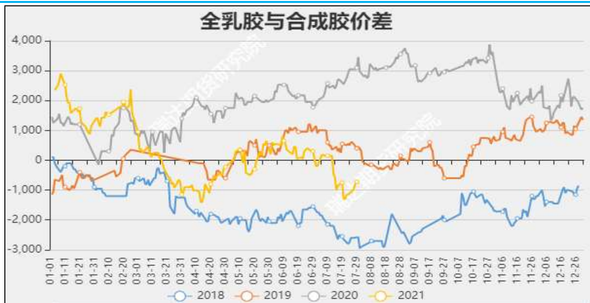
图11 全乳胶与合成胶价差

截至7月29日, 华东市场丁苯橡胶13600元/吨, 较上周-300元/吨; 华北市场顺丁橡胶报13920元/吨, 较上周+0元/吨。