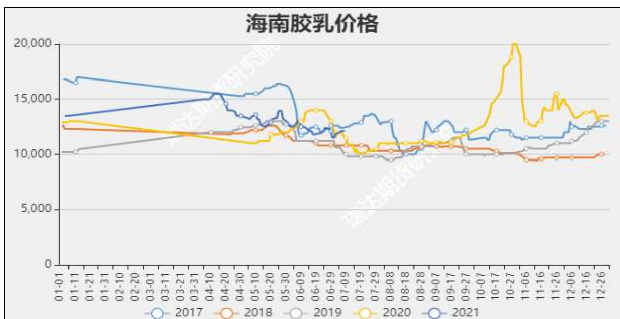
图3 海南新鲜胶乳收购价