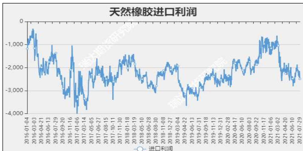
图15 天然橡胶进口利润

截至7月15日，烟片胶加工利润259.25元/吨；标胶加工利润78.13美元/吨。