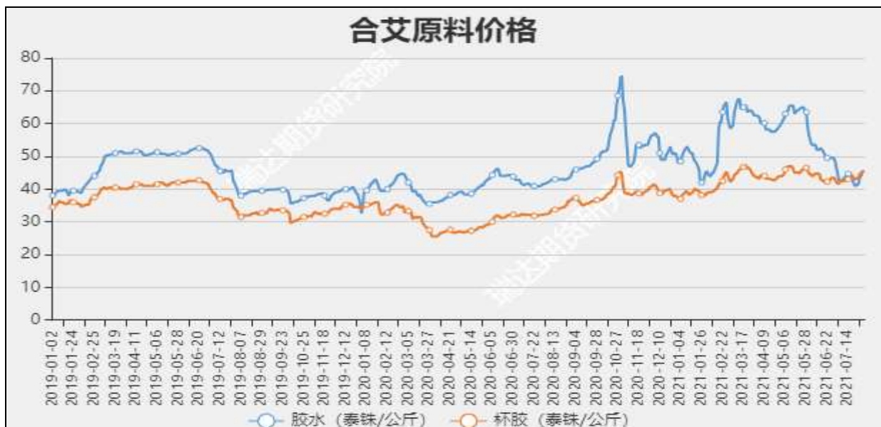
图1 国内天然橡胶市场价