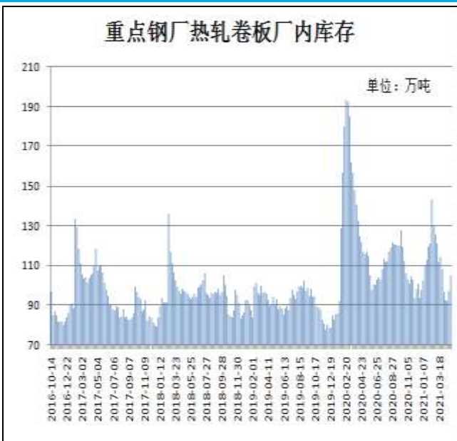
图9：样本钢厂热卷厂内库存

5月6日，据Mysteel监测的全国37家热轧板卷生产企业中热卷厂内库存量为105.02万吨，较上周增加7.91万吨，较去年同期减少10.63万吨。