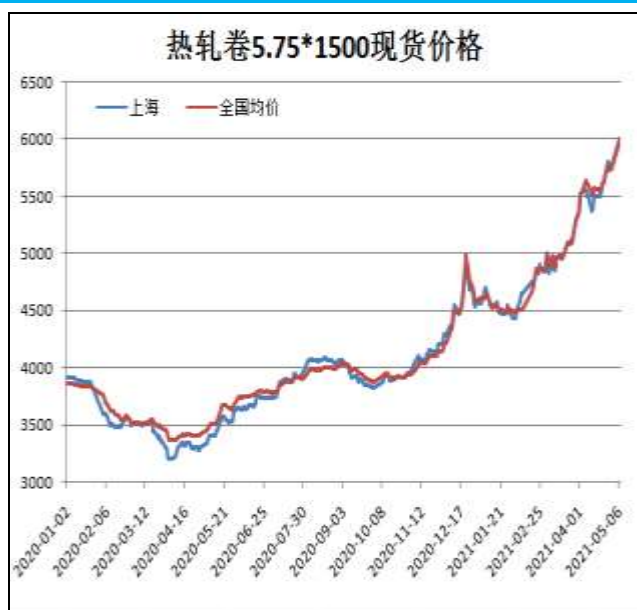
图1：热轧卷板现货价

5月7日，上海热轧卷板5.75mm Q235现货报价为6000元/吨，周环比+230元/吨；全国均价为6010元/吨，周环比+262元/吨。