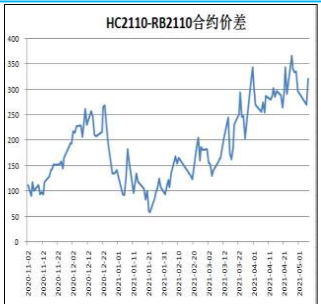
图6：热卷与螺纹跨品种套利

本周，HC2110合约走势强于RB2110合约，7日价差为321元/吨，周环比+24元/吨。