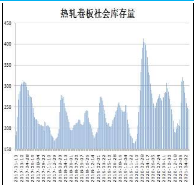
图10：全国33城热卷社会库存

5月6日，据Mysteel监测的全国33个主要城市社会库存为257.21万吨，较上周增加12.38万吨，较去年同期减少68.42万吨。