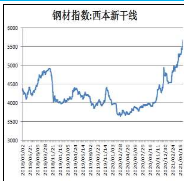
图2：西本新干线钢材价格指数

5月7日，上海热轧卷板5.75mm Q235现货报价为6000元/吨，周环比+230元/吨；全国均价为6010元/吨，周环比+262元/吨。