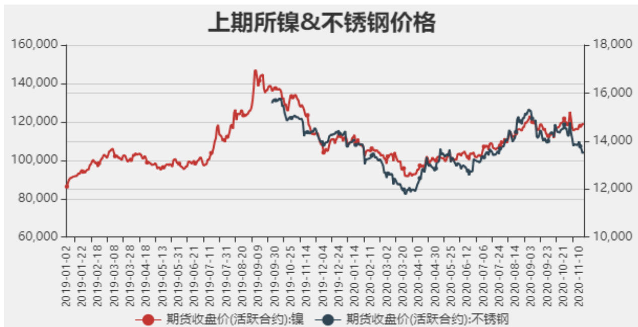
图2：国内镍现货价格

截止至2020年11月13日，沪镍期货价格为118580元/吨，不锈钢期货价格为13550元/吨。