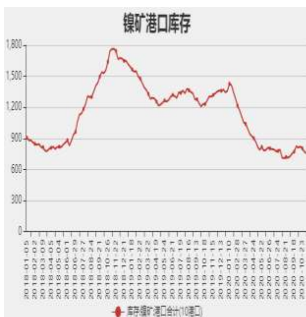
图3：国内镍矿港口库存