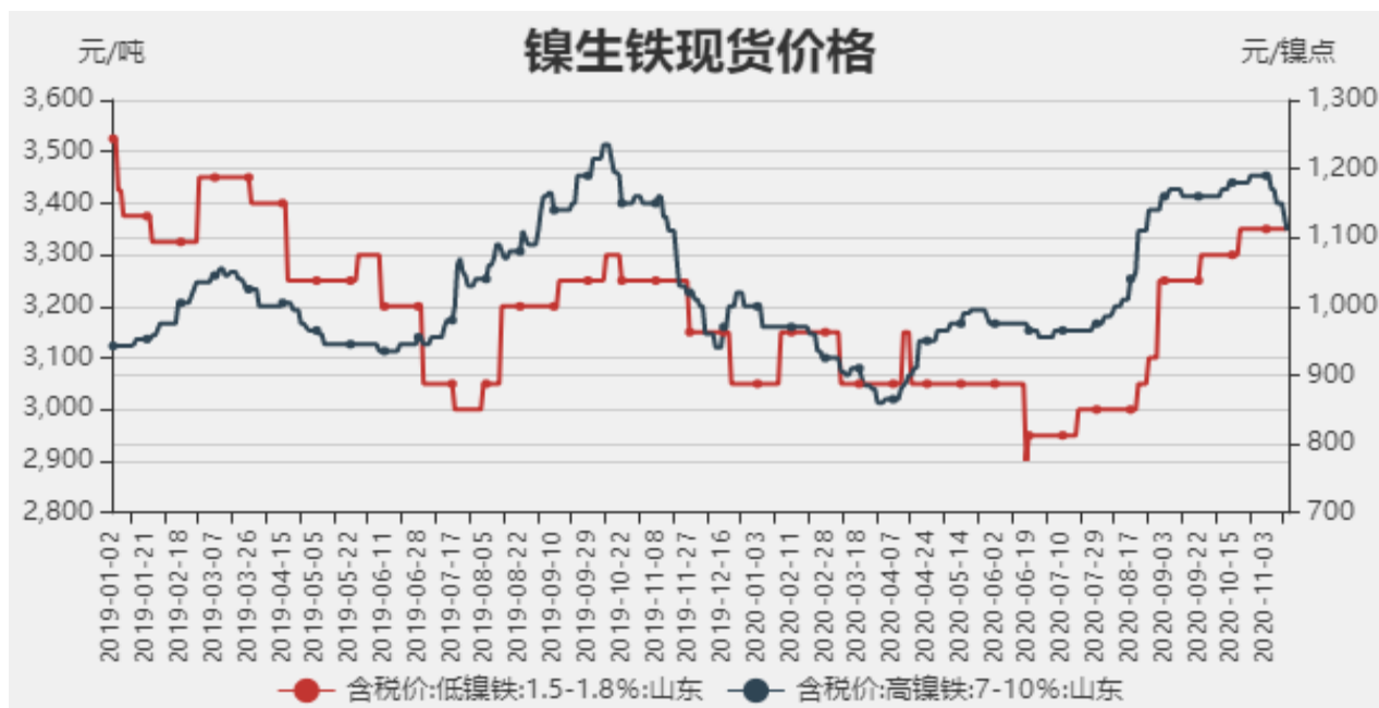
图1：镍生铁现货价格

截止至2020年11月13日，以山东地区为例，低镍铁（FeNi1.5-1.8）价格为3350元/吨，较上周持平，高镍生铁（FeNi7-10）价格为1110元/镍点，较上周下跌60元/镍点。