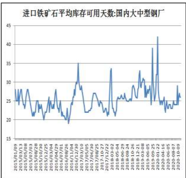
图10：钢厂铁矿石可用天数

13日Mysteel钢厂铁矿石库存统计64家样本，进口烧结粉总库存进口烧结粉总库存1691.08万吨；烧结粉总日耗58.21万吨；库存消费比29.05，进口矿平均可用天数26天。