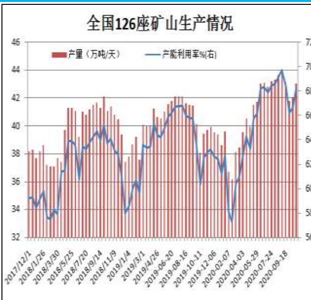
图13: 全国126座矿山产能利用率

据Mysteel统计，截止10月30日全国126座矿山样本产能利用率为68.24%，环比上期调研增1.56%；库存124.05万吨，降4.29万吨。