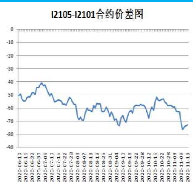
图5：铁矿石跨期套利

本周，I2105合约走势弱于I2101合约，13日价差为-73元/吨，周环比-10元/吨。