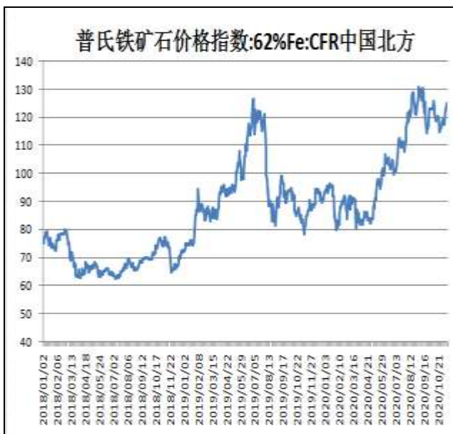
图9：62%铁矿石普氏指数

本周，62%铁矿石普氏指数震荡上行，13日价格为23.4美元/吨，周环比+5.3美元/吨