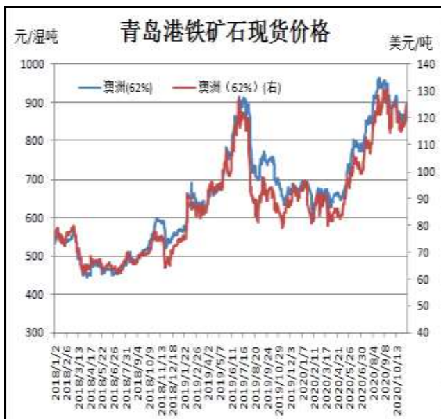
图1：铁矿石现货价格走势