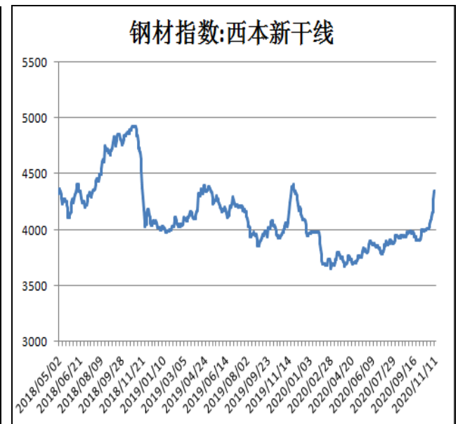
图2：西本新干线钢材价格指数