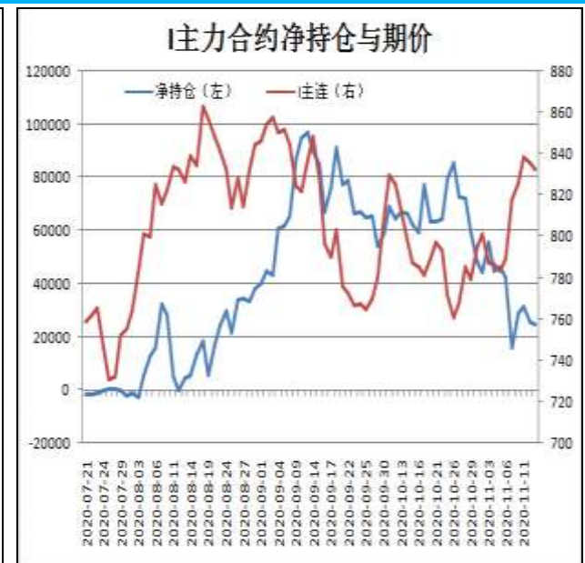
图14: 铁矿主力合约前20名净持仓

I2101合约前20名净持仓情况，6日为净多42283手，13日为净多24454手，净多减少17829手，由于主流持仓空单增幅大于多单。