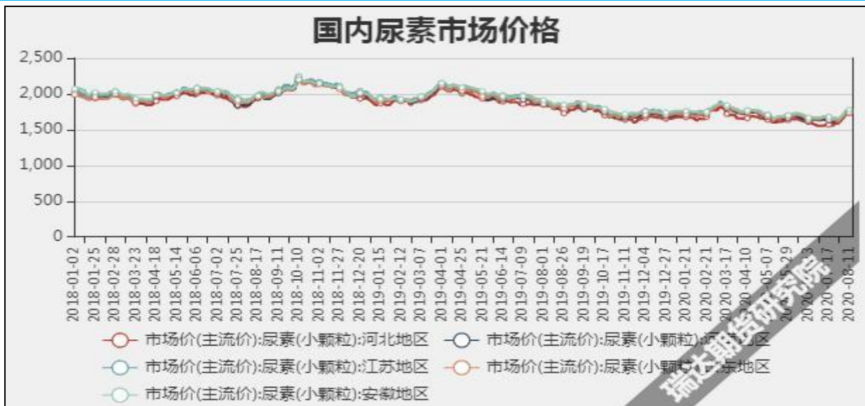
图3 国内尿素市场主流价

截至8月20日, NYMEX天然气收盘价2.36美元/百万英热单位, 较上周+0.17美元/百万英热单位。