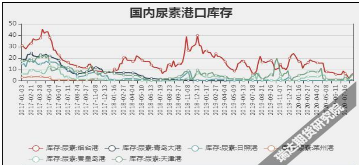
图9 国内尿素港口库存