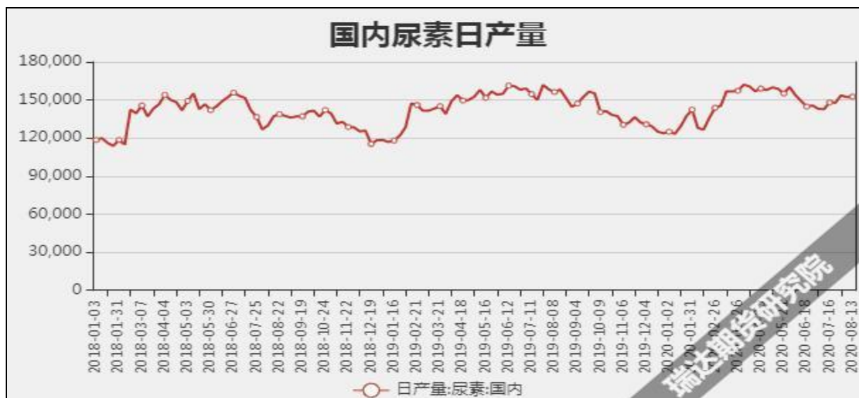
图7 国内尿素日产量