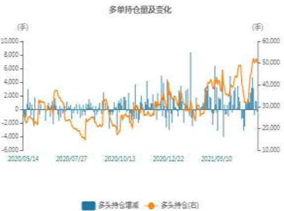
图2：沪铅多头持仓走势图