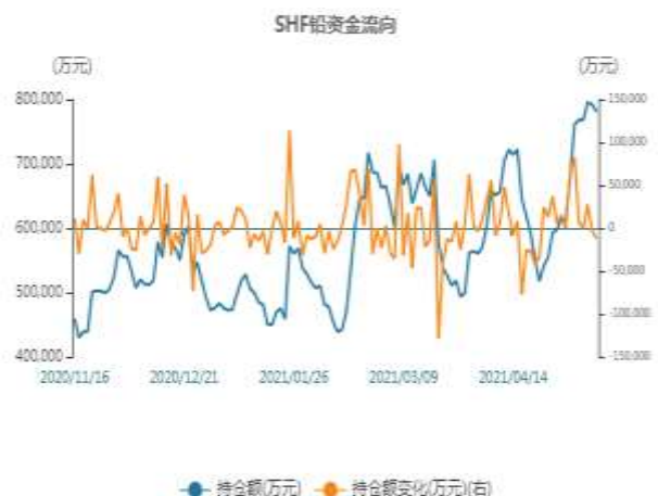
图4：期铅资金流向走势图