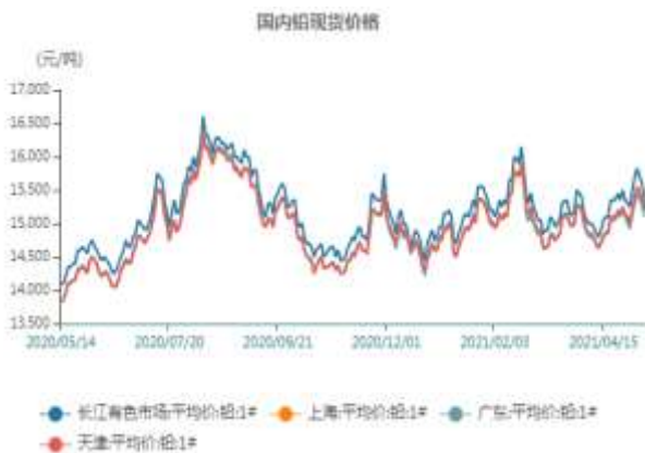
图7、国内铅现货价格走势

截止至2021年5月14日，长江有色市场1#铅平均价为15200元/吨；上海、广东、天津三地现货价格分别为15200元/吨、15100元/吨、15200元/吨。