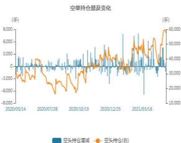
图3：沪铅空头持仓走势图