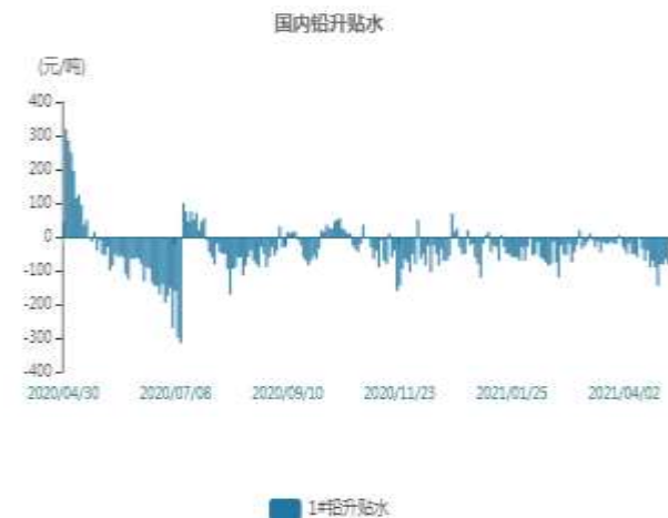
图10：国内铅现货升贴水走势图

截止至2021年5月13日，LME3个月铅期货价格为2150.5美元/吨，LME铅现货结算价为2116美元/吨。