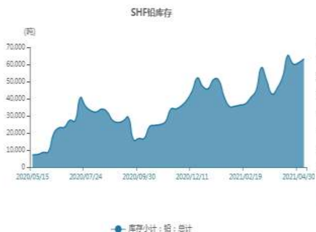
图12：上海铅库存走势图