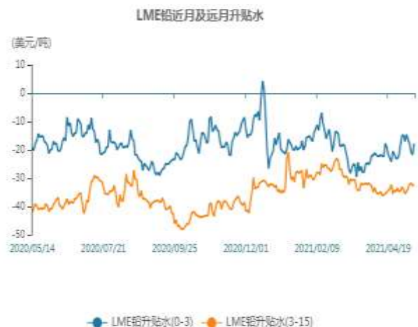
图11：LME铅现货贴水走势图

截止至2020年5月13日，LME铅近月与3月价差报价为贴水17.75美元/吨，3月与15月价差报价为贴水32.7美元/吨。