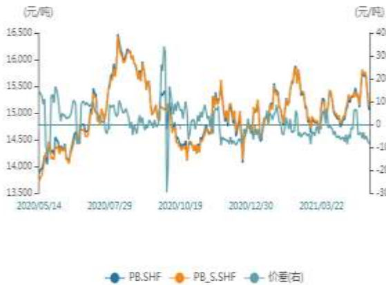
SHF铅主力与次主力合约价格和价差