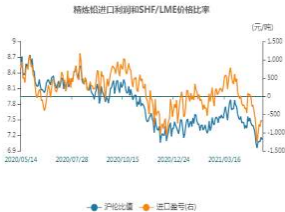
图1：铅两市比值走势图