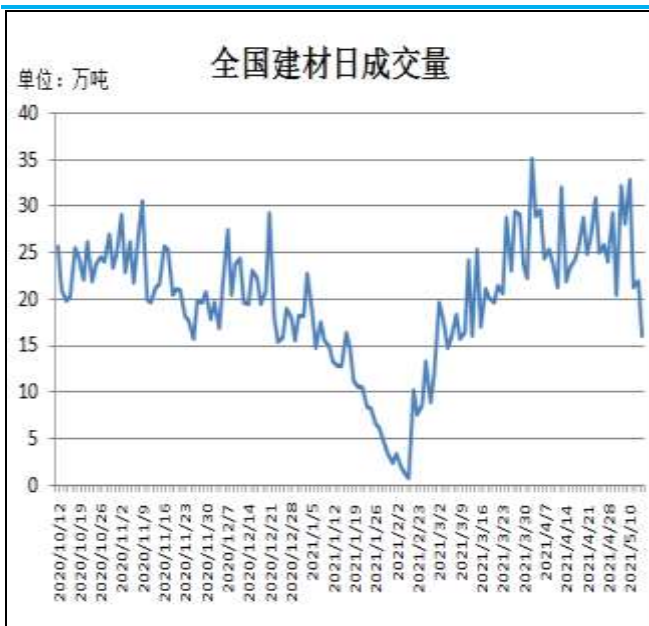
图13: 全国建材日成交量

据Mysteel统计数据,5月10日-13日全国建材成交量为91.93万吨,由于价格持续走高,下游抵触心理提升,成交量萎缩。