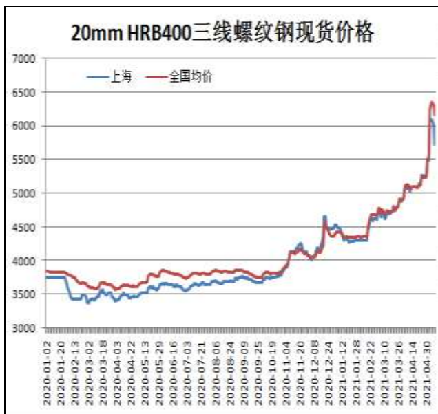
图1：螺纹钢现货价格

5月14日，上海三级螺纹钢20mmHRB400现货报价为5730元/吨，周环比+240元/吨；全国均价为6160元/吨，周环比+589元/吨。