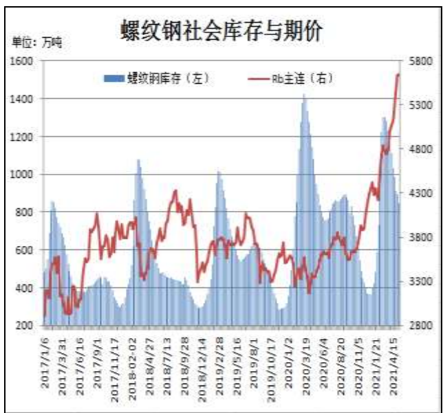
图10：全国35城螺纹钢社会库存

Mysteel统计数据显示，5月13日全国35个主要城市建筑钢材库量为864.64万吨，较上周减少32.11万吨，较去年同期减少28.56万吨，螺纹钢社会库存继续下滑。