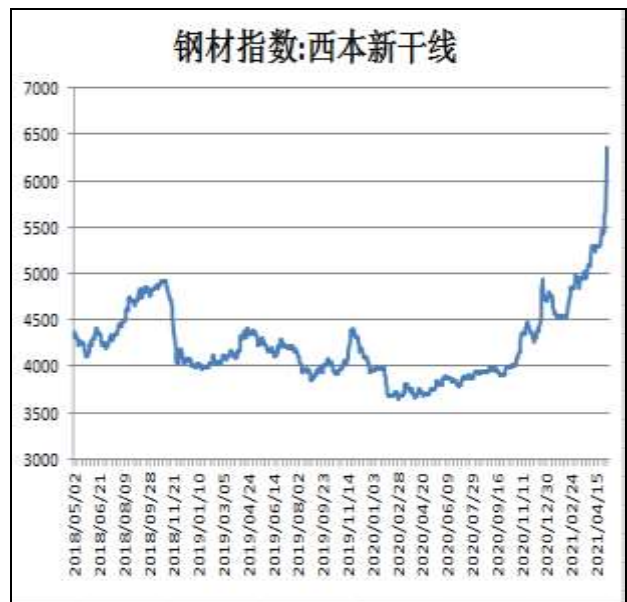
图2：西本新干线钢材价格指数

5月14日，上海三级螺纹钢20mmHRB400现货报价为5730元/吨，周环比+240元/吨；全国均价为6160元/吨，周环比+589元/吨。