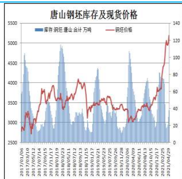
图14: 唐山钢坯库存量

5月6日,唐山钢坯库存量为37.46万吨,较上周增加7.69万吨,钢坯现货报价5190元/吨。