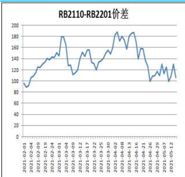
图5：螺纹钢跨期套利

本周，RB2110合约走势弱于RB2201合约，14日价差为106，周环比-19元/吨。