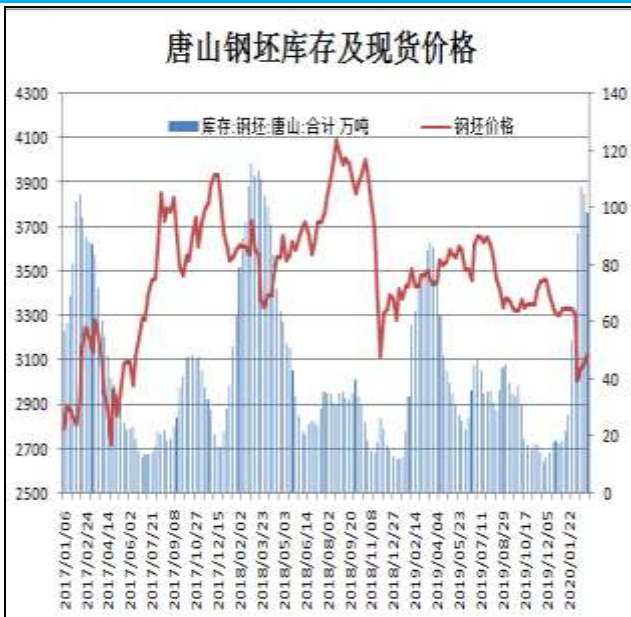
图14：唐山钢坯库存量

3月13日，唐山钢坯库存量为98.29万吨，较上周减少6.71万吨，钢坯现货报价3130元/吨。