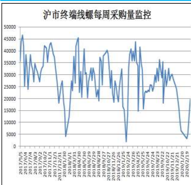
图13：沪市终端线螺采购量

据统计数据显示，本周沪市终端线螺周度采购量为19500吨，较上一周增加5900吨。