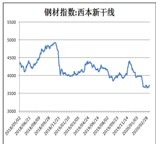
图2：西本新干线钢材价格指数

3月13日，上海三级螺纹钢20mm HRB400现货报价为3470元/吨，较上周五涨30元/吨。