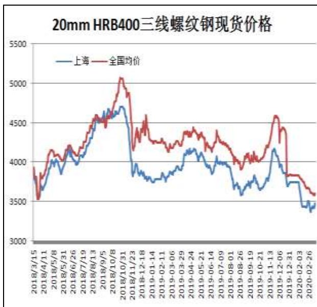
图1：螺纹钢现货价格

3月13日，上海三级螺纹钢20mm HRB400现货报价为3470元/吨，较上周五涨30元/吨。