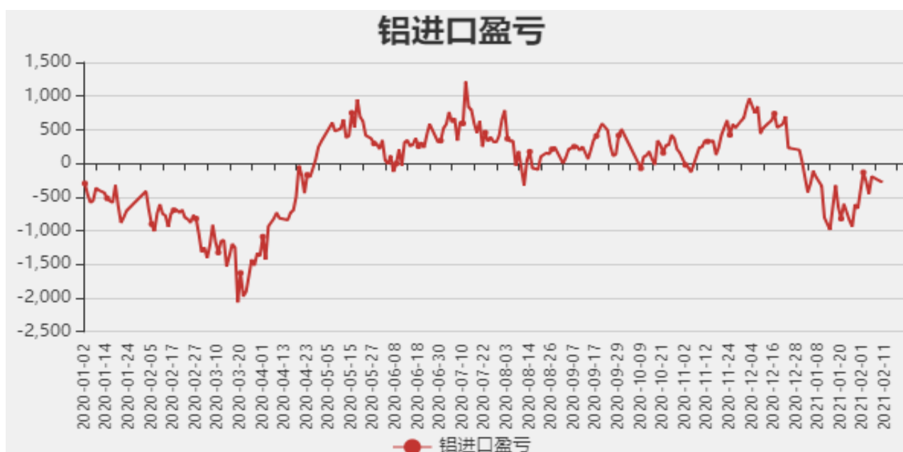
图5：铝进口利润和沪伦比值

截止至2月10日，贵阳氧化铝价格为2355元/吨；库存方面，截止至2月5日，国内总计库存为53.8万吨。