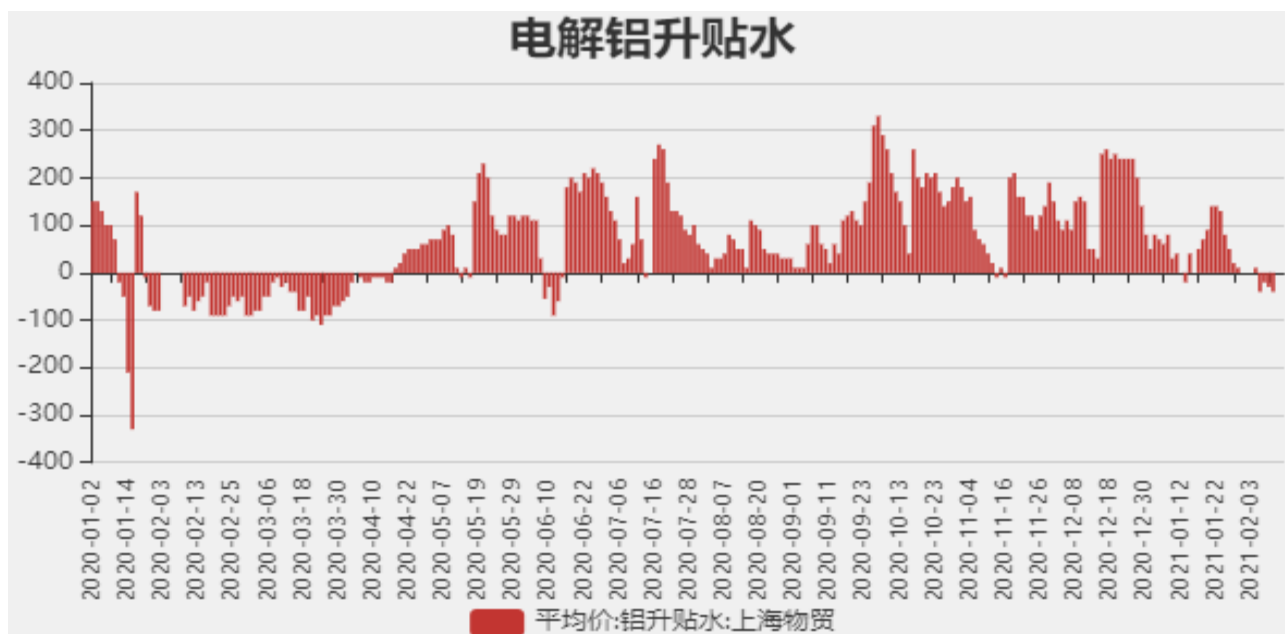
图2：电解铝升贴水走势图

截止至2021年2月19日，长江有色金属1#电解铝平均价为16485元/吨，沪铝期货价格为16420元/吨。