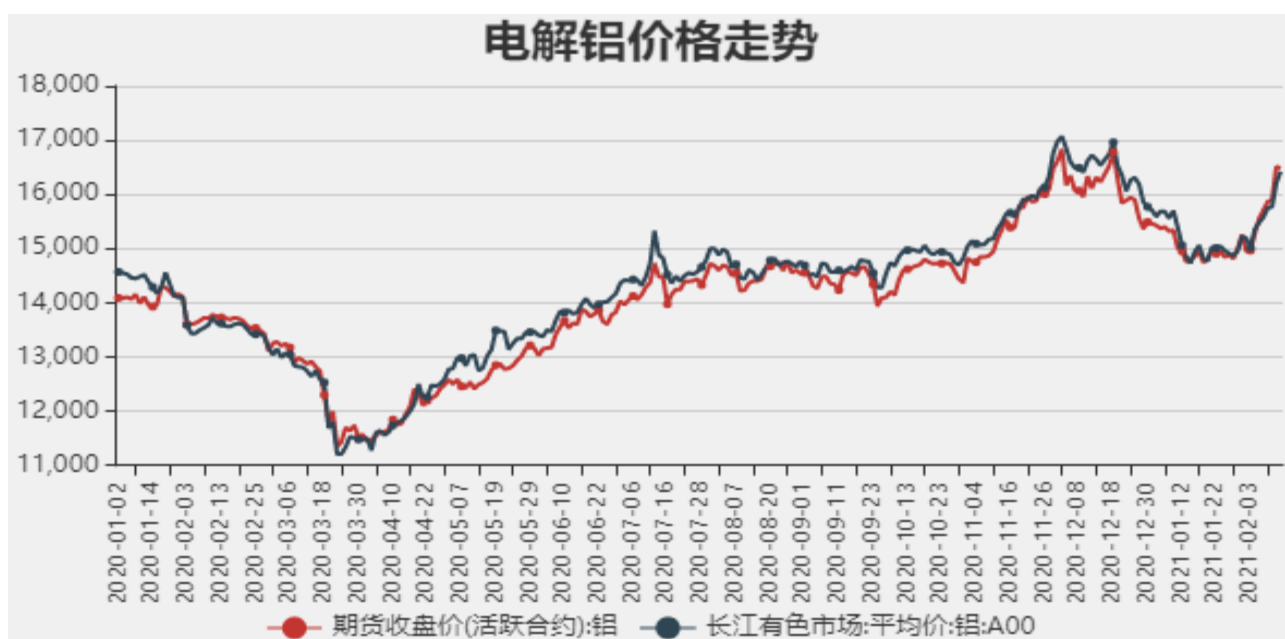
图1：电解铝期现价格

截止至2021年2月19日，长江有色金属1#电解铝平均价为16485元/吨，沪铝期货价格为16420元/吨。