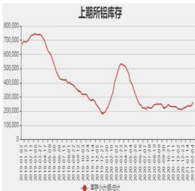
图8：上海期货交易所电解铝库存