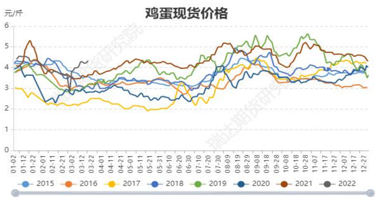
图4：全国鸡蛋现货均价季节性走势图