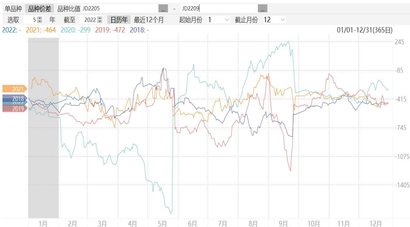
图8：鸡蛋2205合约与2209合约期价价差走势图

8、截至周五，鸡蛋2205合约与2209合约价差报-500元/500千克,处于同期较高水平。