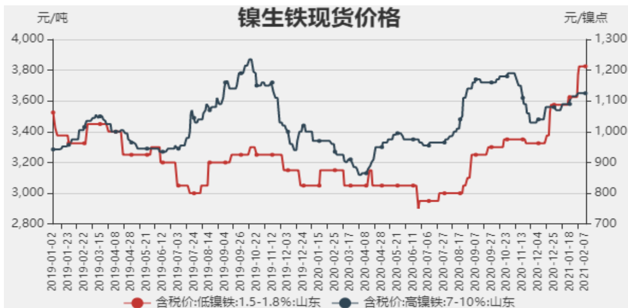
图1：镍生铁现货价格

截止至2021年2月7日，以山东地区为例，低镍铁（FeNi1.5-1.8）价格为3825元/吨，较上周持平，高镍生铁（FeNi7-10）价格为1125元/镍点，较上周持平。