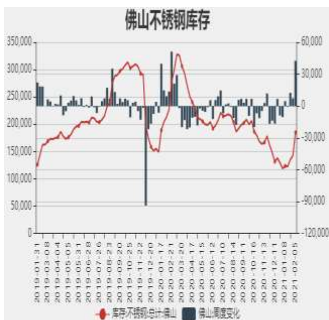
图7：佛山不锈钢月度库存