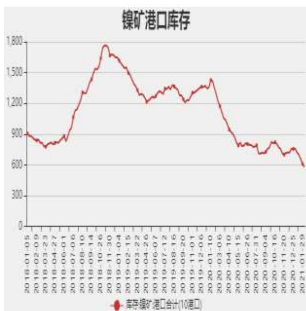
图3：国内镍矿港口库存