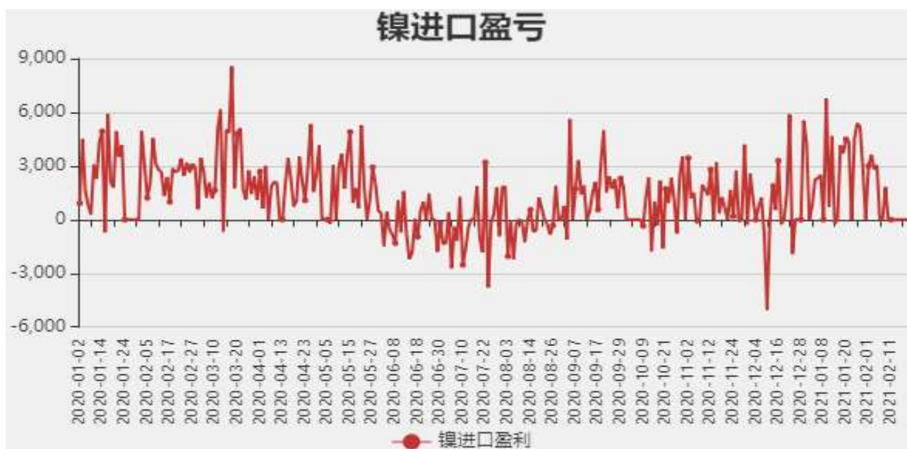
图5：镍进口盈亏分析