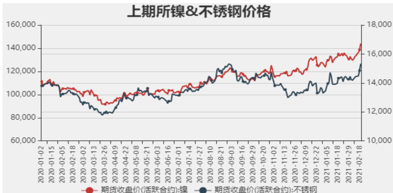
图2：国内镍现货价格

截止至2021年2月19日，沪镍期货价格为144050元/吨，不锈钢期货价格为15330元/吨。