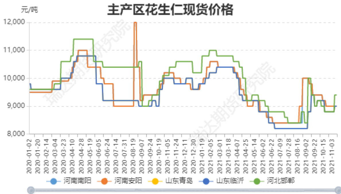
图1：主产区花生仁现货价格

河南主产区春米通货米价格在 8800-9000 元/吨左右，麦茬通货米价格在 8400 元/吨左右，油厂收购油料花生米价格在 7200-7900 之间，不同质量标准差异较大。一般来说，花生期货交割的现货质量略低于通货米，好于油料花生米。