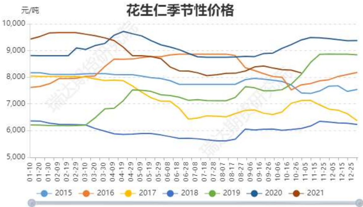
图2：花生仁现货价格季节性

由于大量进口花生以及冻库存货的影响，对国内花生市场冲击较大，花生价格较往年偏低。