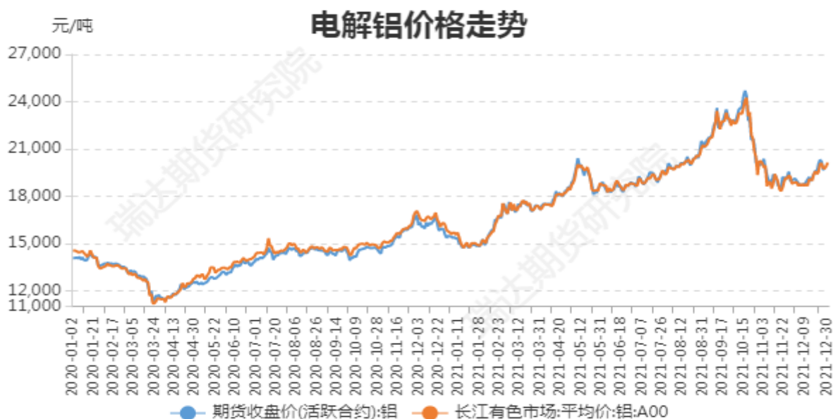
图1：电解铝期现价格

截止至2021年12月31日，长江有色市场1#电解铝平均价为20360元/吨，沪铝期货价格为20380元/吨。