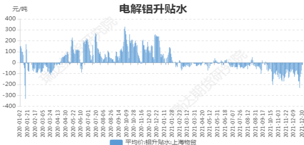
图2：电解铝升贴水走势图

截止至2021年12月31日，长江有色市场1#电解铝平均价为20360元/吨，沪铝期货价格为20380元/吨。