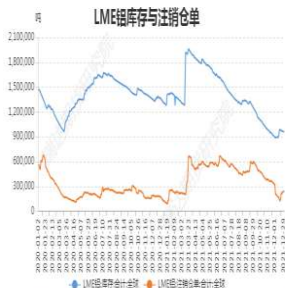
图9：LME铝库存与注销仓单

截止至2021年12月31日，上海期货交易所铝库存323569吨，环比上周减5621吨；LME铝库存939200吨，环比上周减24975吨；注销仓单229575吨，环比上周减5450吨。