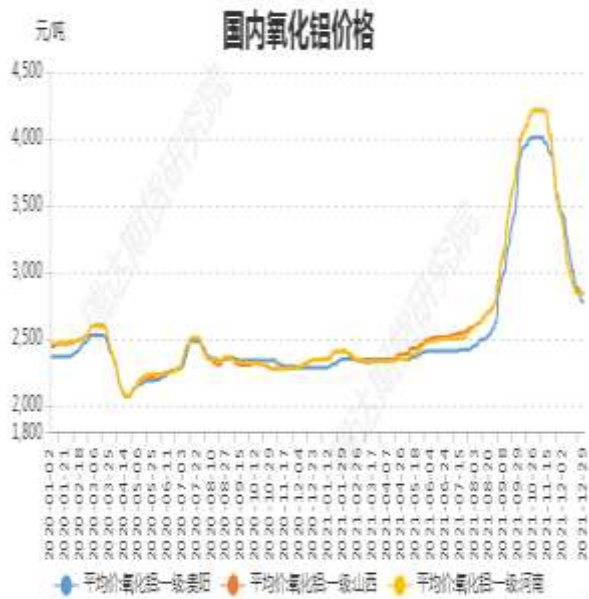
图3：国内氧化铝价格