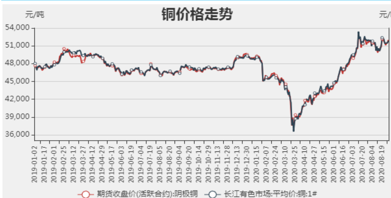
图1：铜期现价格走势

截止至2020年08月28日，长江有色市场1#电解铜平均价为51990元/吨；电解铜期货价格为51820元/吨。