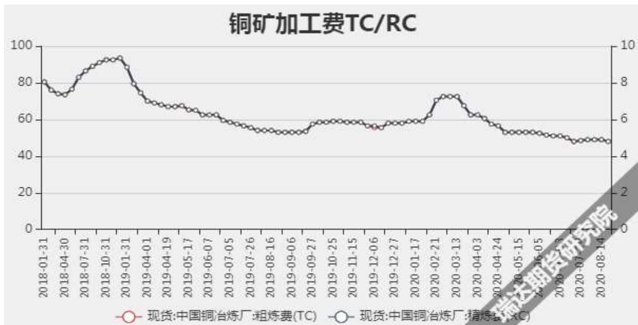
图2：中国铜冶炼加工费

2020年08月21日中国铜冶炼厂粗炼费（TC）为48美元/干吨，精炼费（RC）为4.8美分/磅，较上周持平。