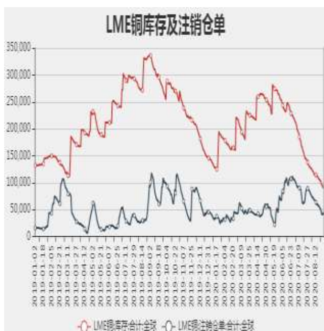
图7：LME铜库存及注销仓单