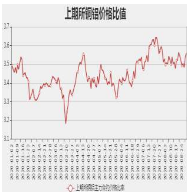
图9：沪铜和沪铝主力合约价格比率