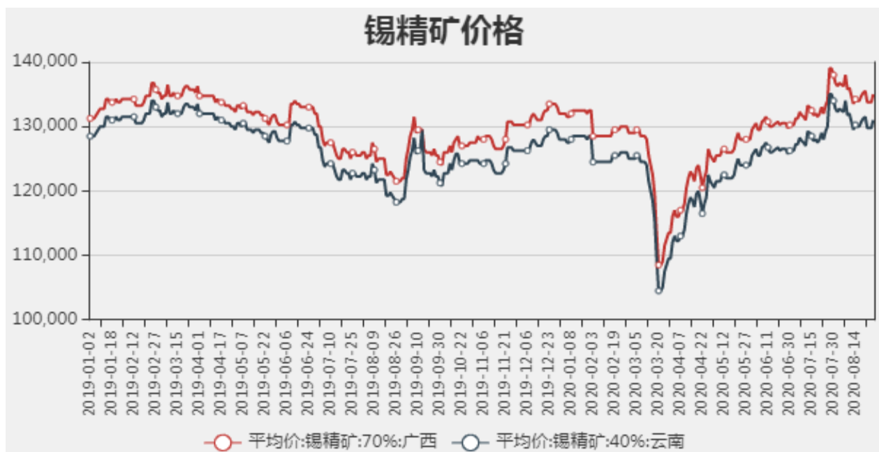
图2：国内锡精矿价格

截止至2020年08月27日，国内广西锡精矿70%价格为135000元/吨，云南锡精矿40%价格为131000元/吨。