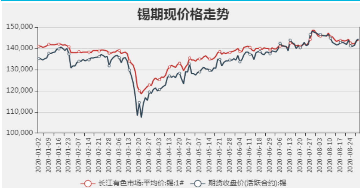
图1：国内锡现货价格

截止至2020年08月28日，长江有色市场1#锡平均价为144000元/吨，沪锡期货价格为144450元/吨。