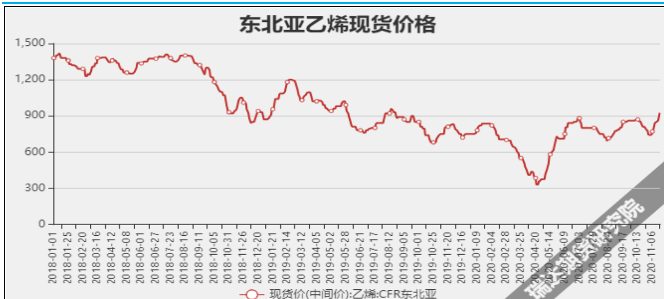
图13 东北亚乙烯现货价

截至11月18日当周，内陆地区部分甲醇代表性企业库存量31.24万吨，较上周+2.23万吨。