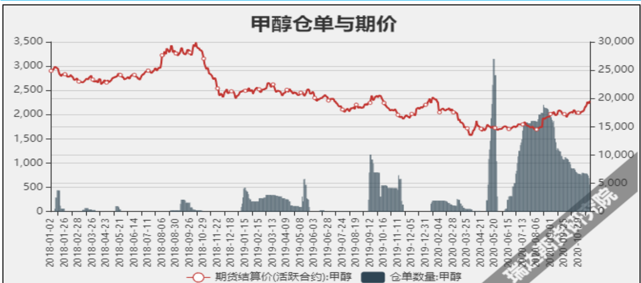
图7 甲醇期价与仓单数量