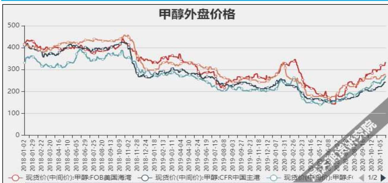
图5 外盘甲醇现货价格

截至11月19日, 西北甲醇与华东甲醇价差-400元/吨, 较上周-65元/吨。