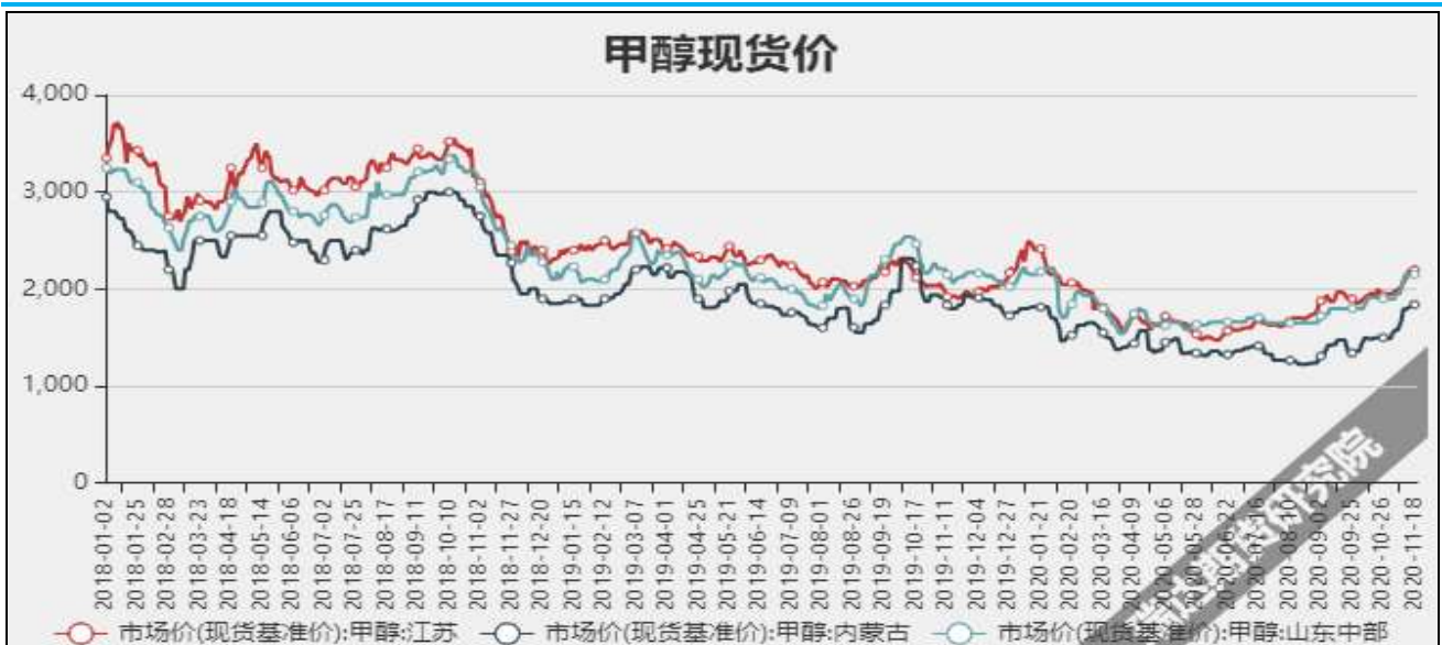
图3 甲醇现货市场主流价

截至11月19日, NYMEX天然气收盘价2.6美元/百万英热单位, 较上周-0.35美元/百万英热单位。