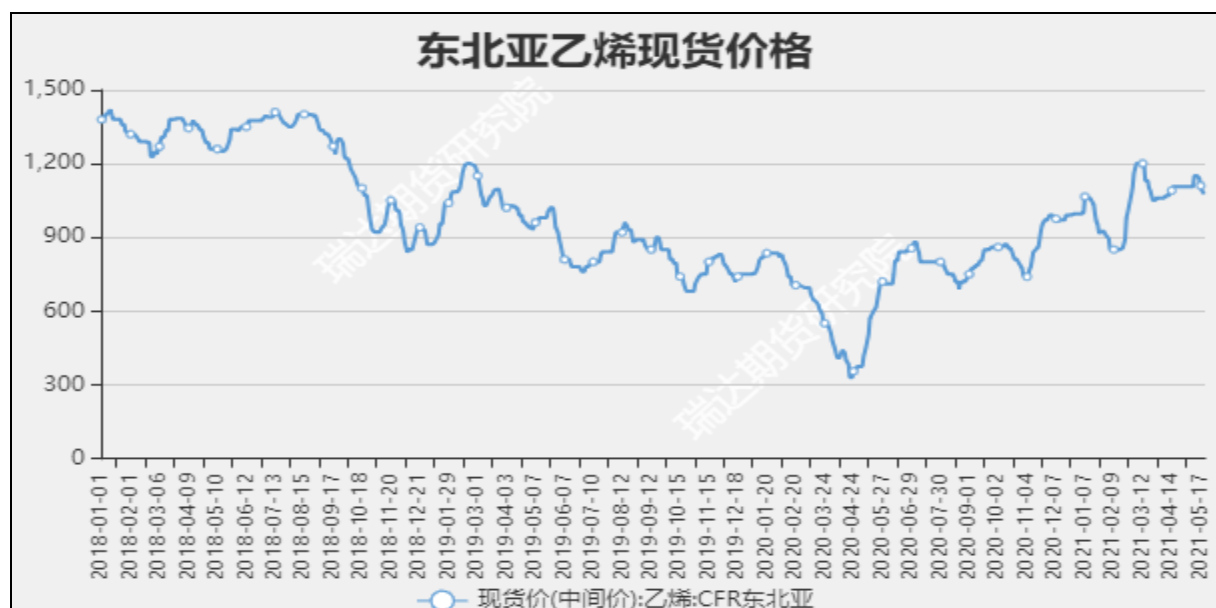
图13 东北亚乙烯现货价

截至5月19日当周，内陆地区部分甲醇代表性企业库存量38.37万吨，较上周+1.83万吨。