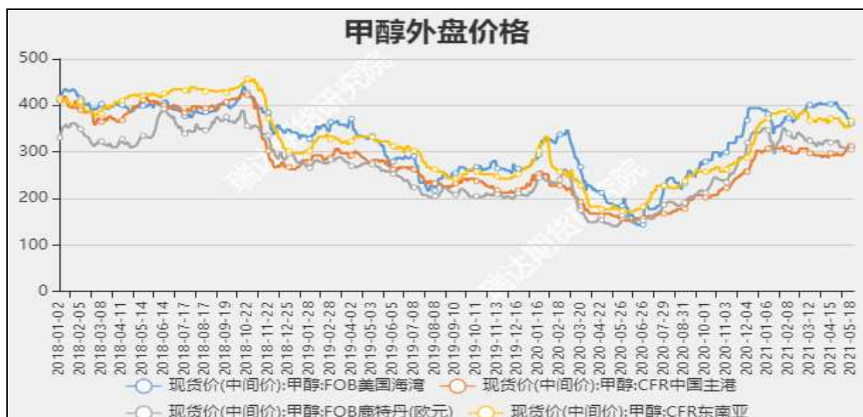
图5 外盘甲醇现货价格