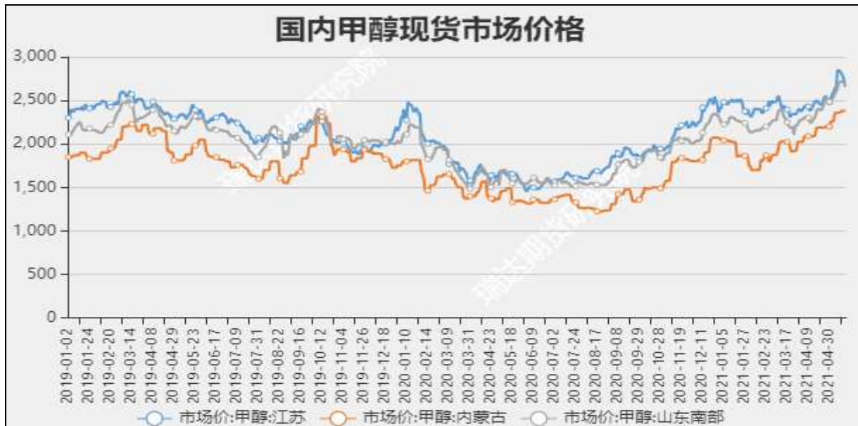
图3 甲醇现货市场主流价

截至5月20日, NYMEX天然气收盘价2.95美元/百万英热单位, 较上周-0.02美元/百万英热单位。