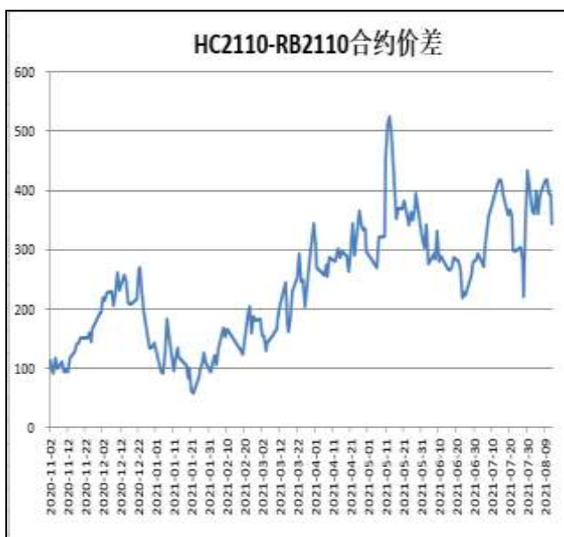
图6：热卷与螺纹跨品种套利

本周，HC2110合约走势弱于RB2110合约，13日价差为344元/吨，周环比-49元/吨。价差400附近空卷多螺策略，可考虑350下方分批减仓。