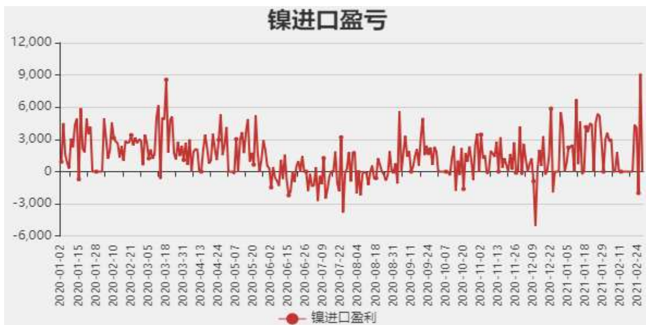
图5：镍进口盈亏分析