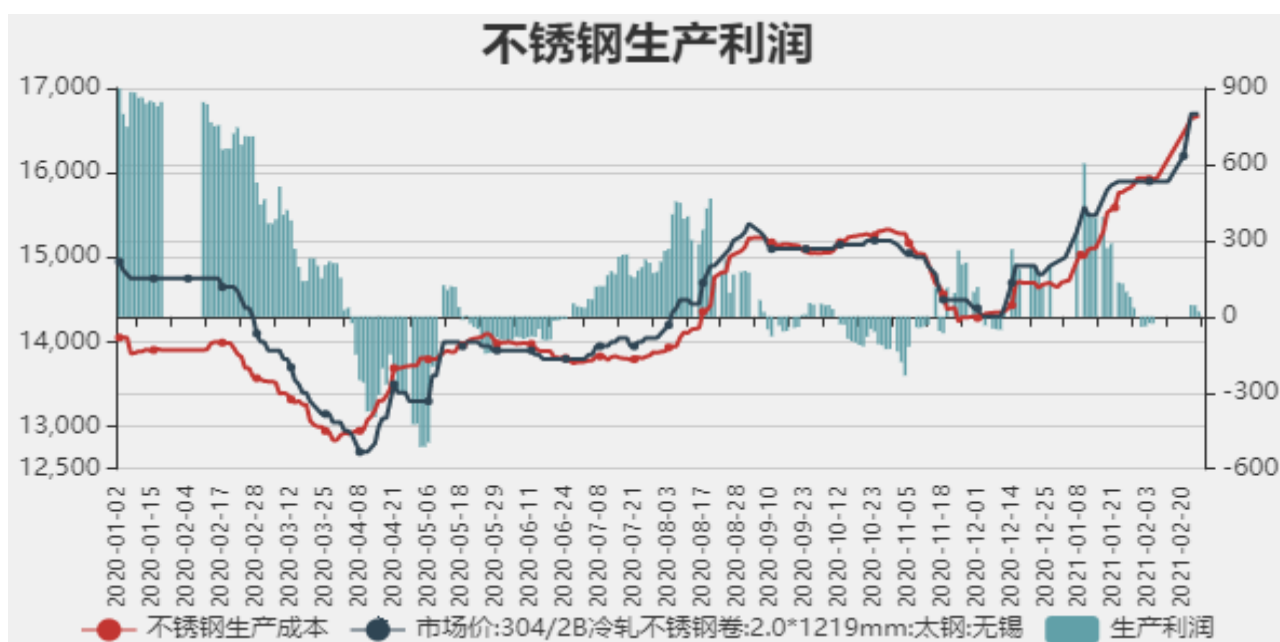
图10：不锈钢生产利润