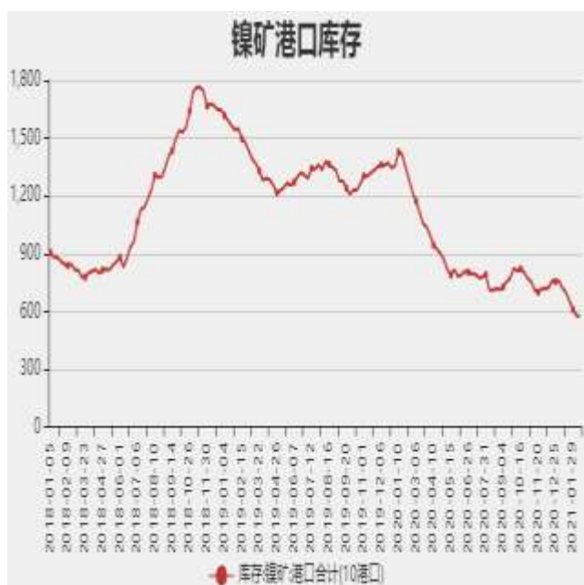
图3：国内镍矿港口库存