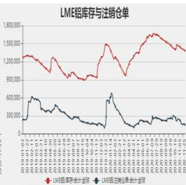
图9：LME铝库存与注销仓单比率

截止至2020年11月20日，上海期货交易所电解铝库存为232091吨。截止至2020年11月26日，LME 铝库存为1383250吨，注销仓单为155300吨。