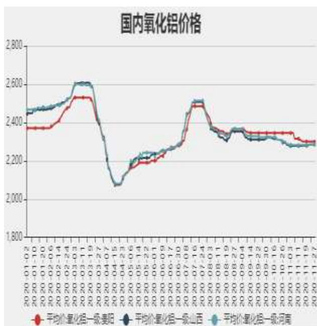
图3：国内氧化铝价格