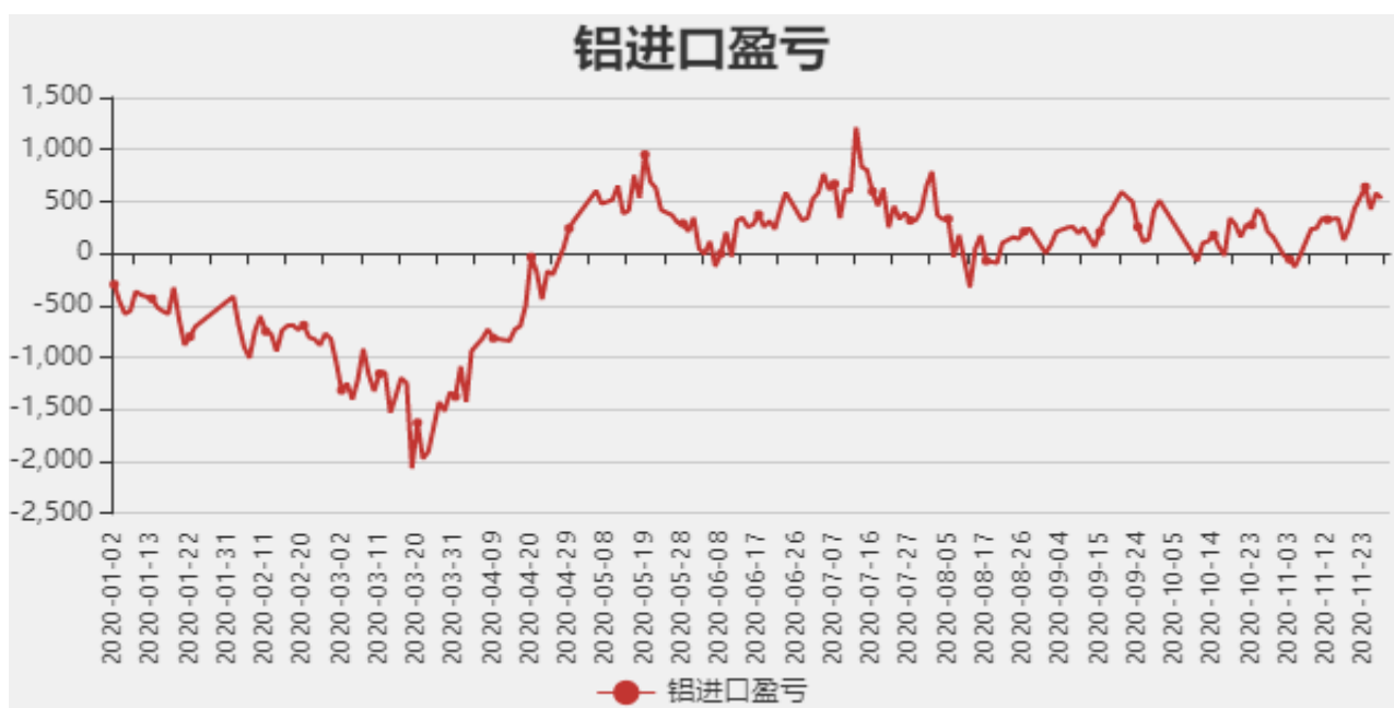
图5：铝进口利润和沪伦比值

截止至11月27日，贵阳氧化铝价格为2300元/吨；库存方面，截止至11月20日，国内总计库存为61.5万吨。