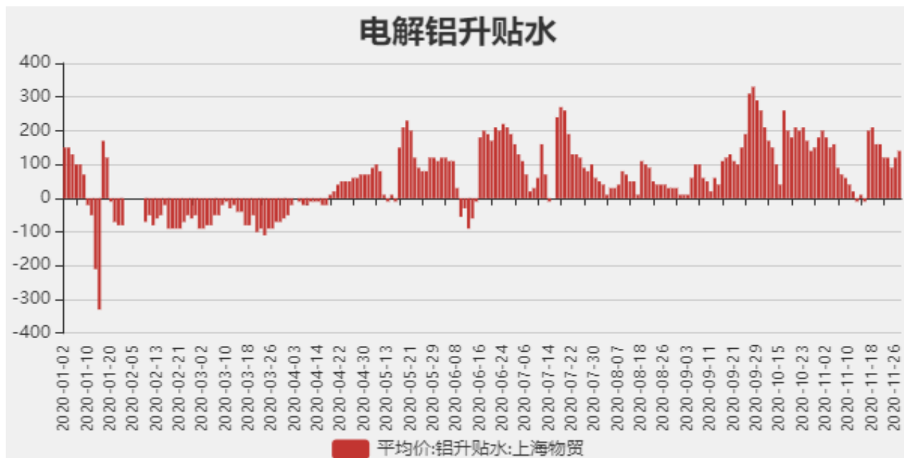
图2：电解铝升贴水走势图

截止至2020年11月27日，长江有色市场1#电解铝平均价为16090元/吨，沪铝期货价格为16330元/吨。