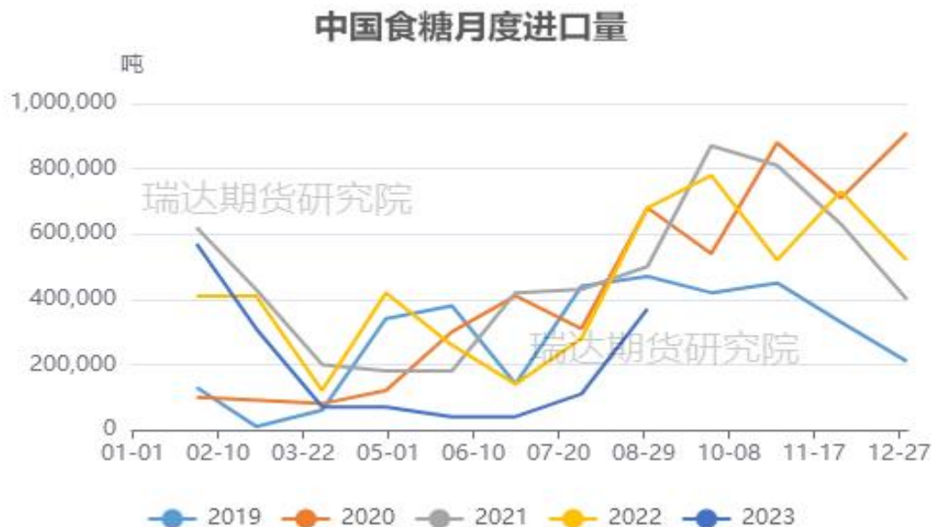
图16、进口食糖数量走势