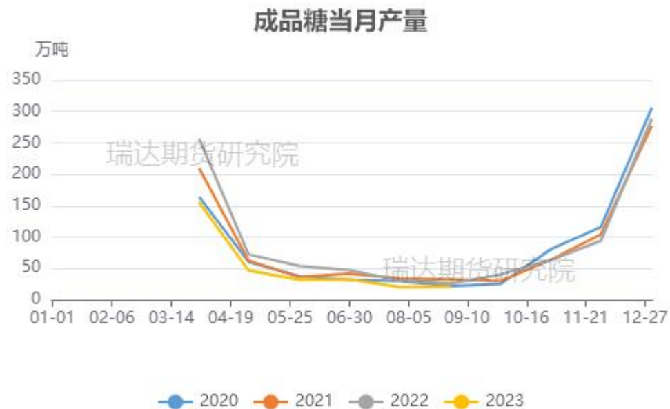
图19、成品糖产量当月值情况