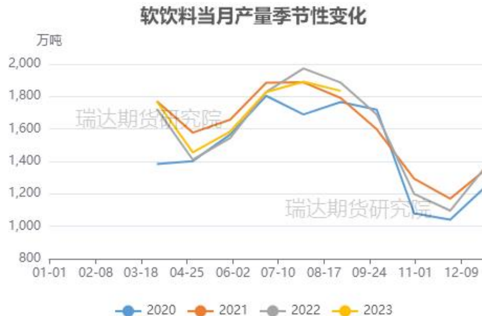
图20、软饮料产量值情况