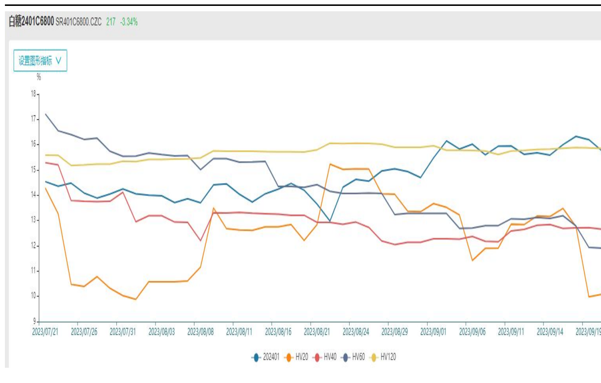
图21、白糖主力合约标的隐含波动率