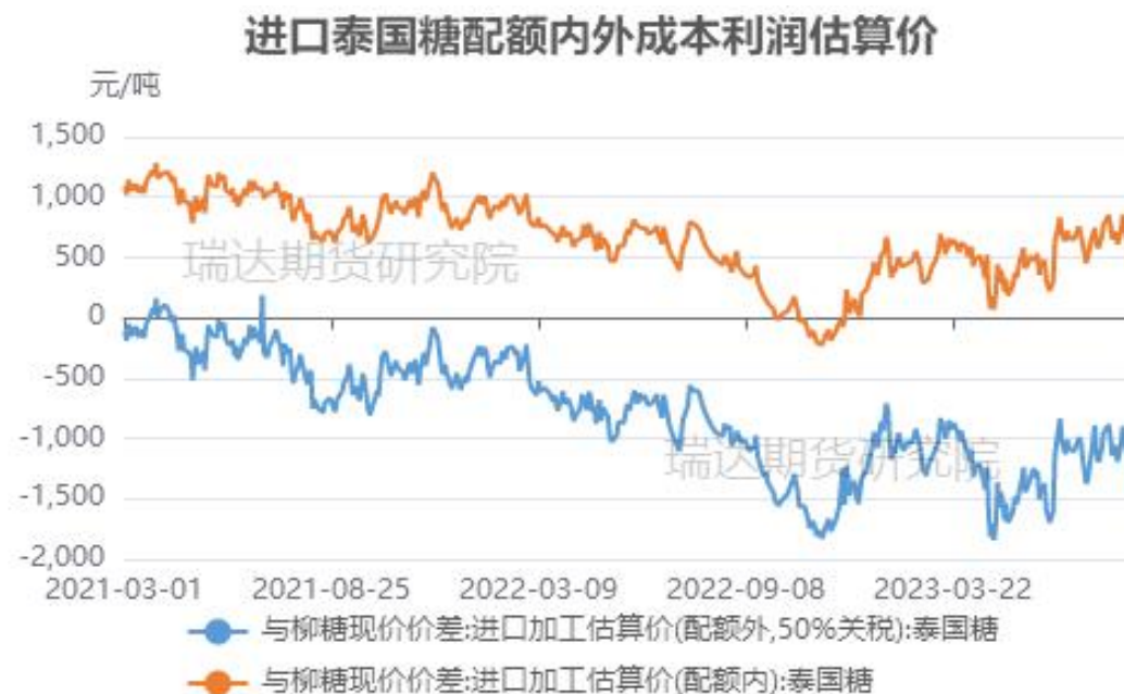
图13、进口泰国糖利润空间走势