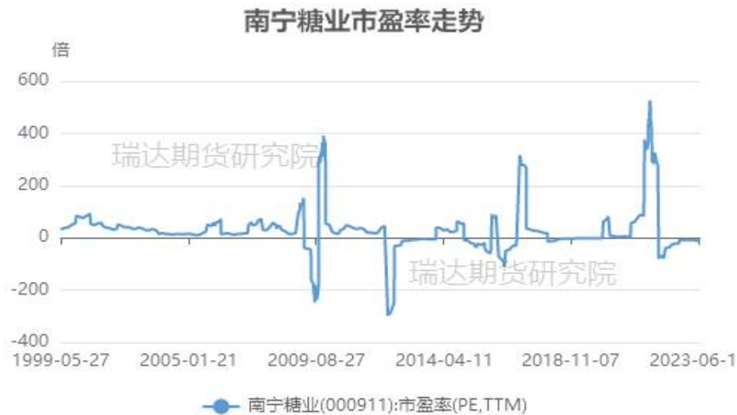
图22、南宁糖业市盈率