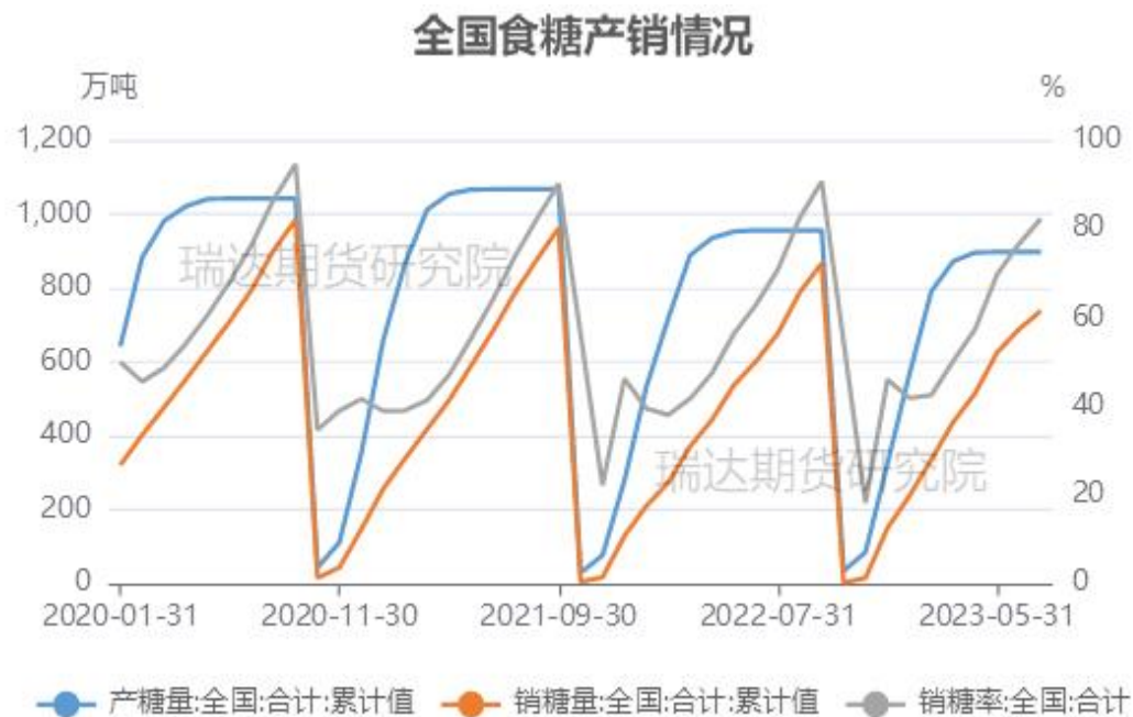
图17、全国食糖销量累计情况