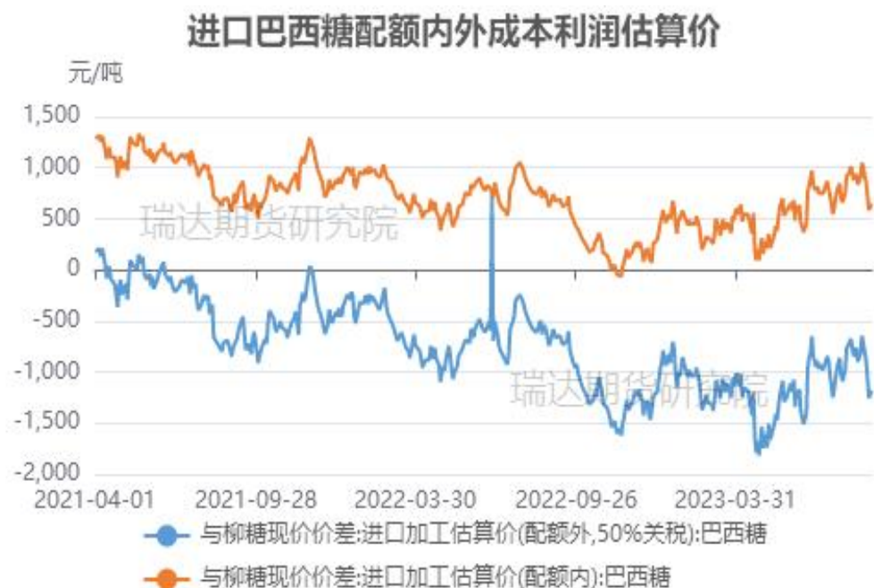
图12、进口巴西糖利润空间走势