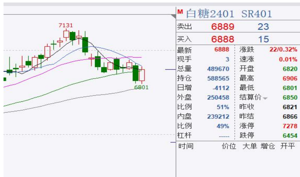
图5、郑糖主力合约价格走势