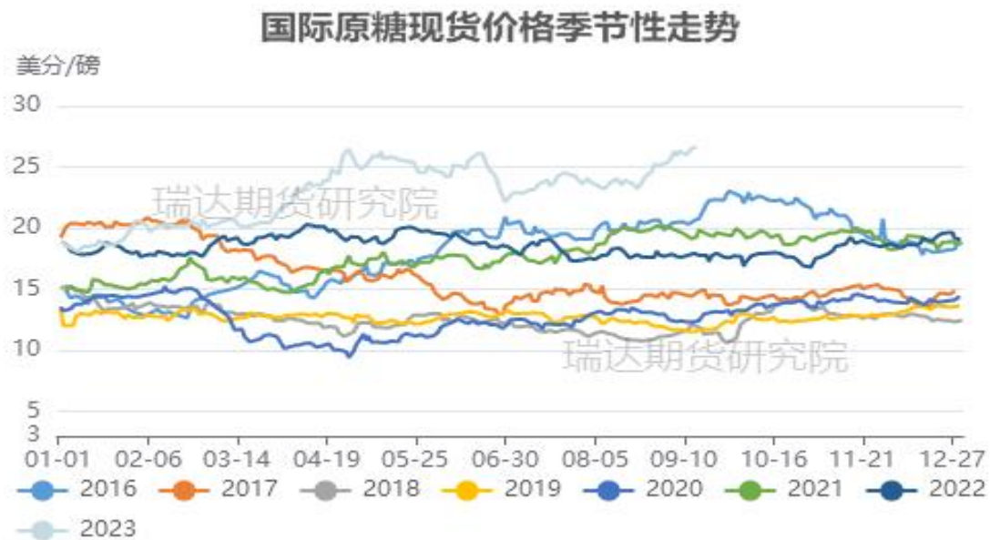
图4、国际原糖现货价格指数走势