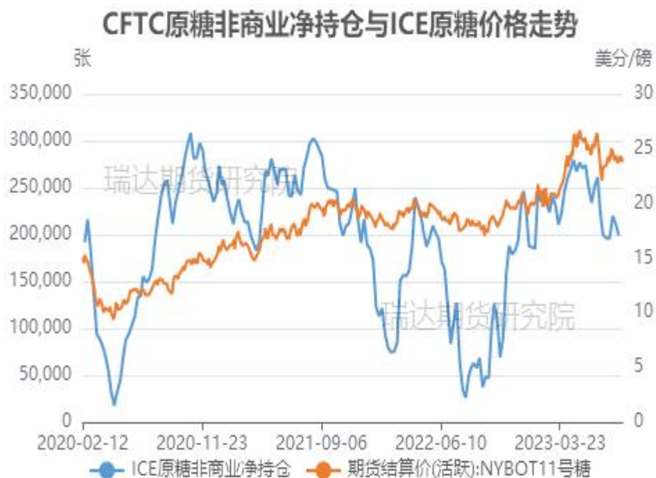
图1、ICE美糖主力合约价格与CFTC原糖净持仓走势