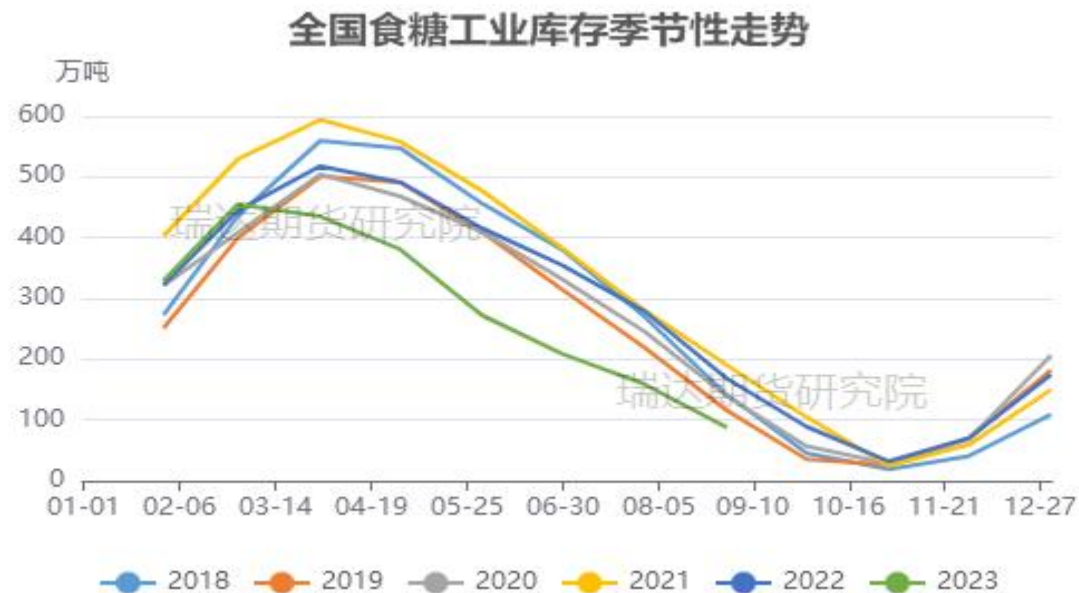
图15、食糖工业库存情况