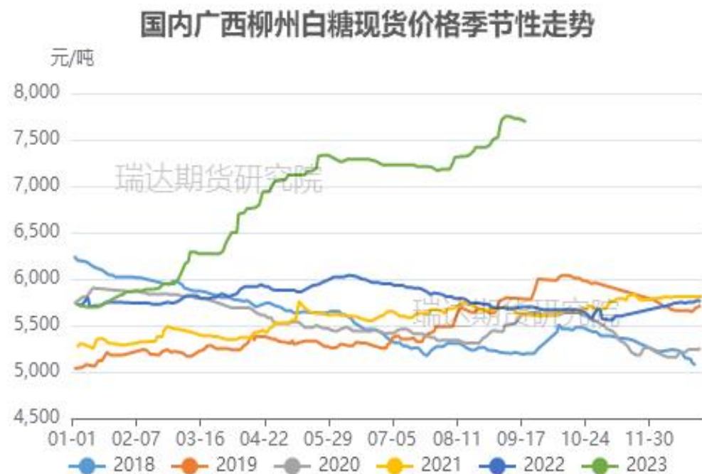
图10、广西柳州现货价格季节性走势