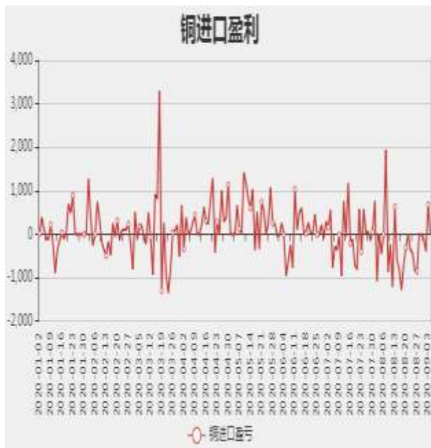
图3：精炼铜进口利润