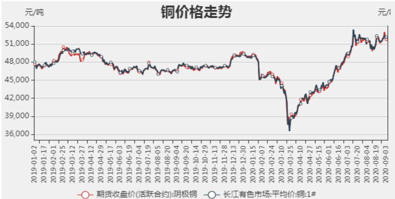
图1：铜期现价格走势

截止至2020年09月04日，长江有色市场1#电解铜平均价为51650元/吨；电解铜期货价格为51550元/吨。