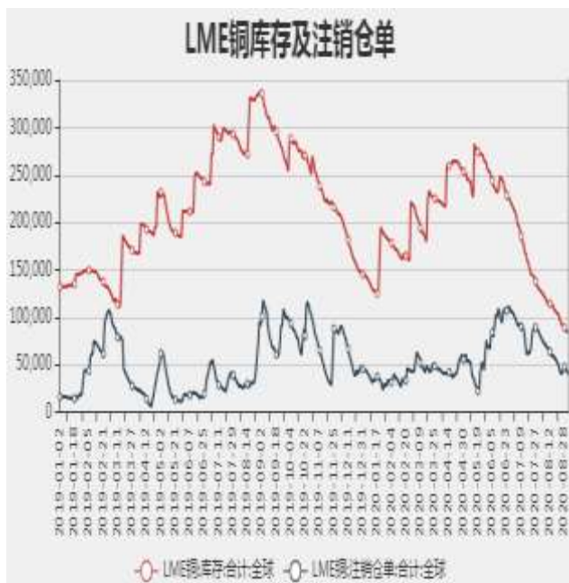
图7：LME铜库存及注销仓单