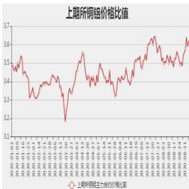
图9：沪铜和沪铝主力合约价格比率